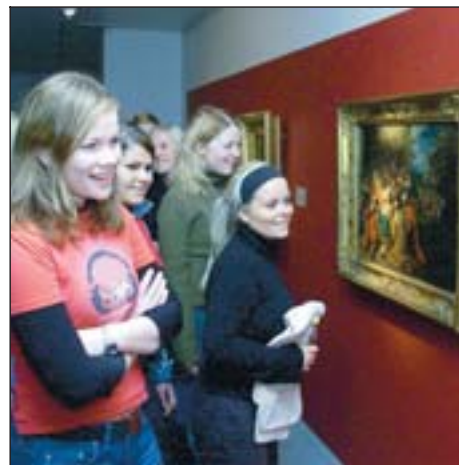
Starfsemi Listasafns Akureyrar hefur vakið verðskuldaða athygli á þessu ári.

Starfsemi Listasafns Akureyrar hefur vakið