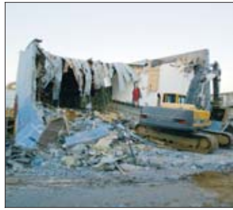
Stjörnuvíói var rífið á árinu.

Kvikmynda- listin hefur sérstöðu gagnvart öðrum listmiðlum, a.m.k. hinum klassískari, í mörgu tilliti. Hún býður upp á mikla fjöldadreif- ingu, og er aðgengilegt menningarneysluforn. Þessu gerðu menn sér grein fyrir þegar í árdaga kvikmynda- listarinnar og tóku Bandaríkjamenn snemma þá stefnu að gera kvikmyndafram- leiðslu að einni helstu framleiðslu- og útlut- ingsvöru sinni. Svíptingar sögunnar, þar sem kvikmyndaframleiðsla í Evrópu lamaðist á ár- um heimsstyrjaldanna tveggja, og útsjónarsemi kvikmynda- mórgúla hafa veitt bandarískum kvik- myndum ráðandi stöðu á heimsmarkaði. Í þess- um iðnaði, sem kenndur er við Hollywood, hafa menn síðan komið sér upp stöðluðu framleiðslu- kerfi og skilvirku dreifingarkerfi sem miðar að því að skila hámarksgróða og veitir takmarkað rúm fyrir listræna eða hugmyndalega frum- sköpun. Og með kvikmyndir er líkt farið og að- ar listgreinar, þar eiga frumsköpun og hug- myndaleg fjölbreytni eiga ekki alltaf samleið með söluvænleika. Dreifingaraðilar hér á landi