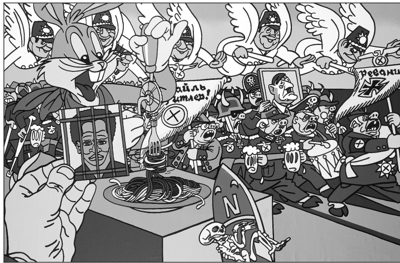
Verk eftir Erró á sýningunni í Listasafni Reykjavíkur – Hafnarhúsi.