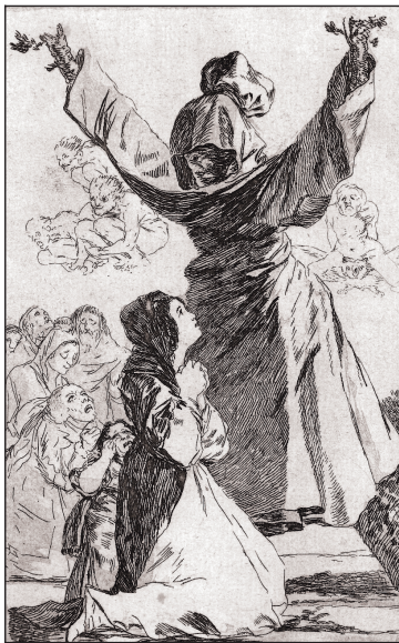
Fötin skapa manninn.

Þegar Kenjarnar eru skoðaðar er vert að hafa í huga að heimurinn og heimsmyndin tóku örum breytingum á ævi Goya. Sjálfur þjónaði hann þremur konungum Spánar og samtíðarmönnum þeirra, þeim Karli III (1759–88), Karli IV (1788–1808) og Ferdinand VII (1808, 1814–33) – en undir harðstjórn þess síðarnefnda þurfti Goya m.a. að svara til saka hjá spænska rannsóknarréttinum.