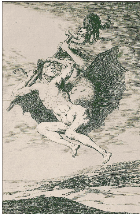
„Parna fer það.“

Röð atburða stuðlaði að sköpun Kenjanna. Hún einkenndist fyrst og fremst af því að Goya gerðist æ fráhrifari staðlaðri listsköpun og hneigðist æ meir að nýsköpun. Þessi nýja sýn á listina tengist svo atburðum í lífi hans. Alvarleg veikindi tóku að hrjá hann, hann stofnaði til náinna kynna við hertogafrúna af Alba og hann var í vinatengslum við hóp virtra menntamanna, einkum rithöfundinn Leandro Fernández de Moratín. Árið 1792 semur Goya skýrslu til Konunglegru listaakademíunnar í