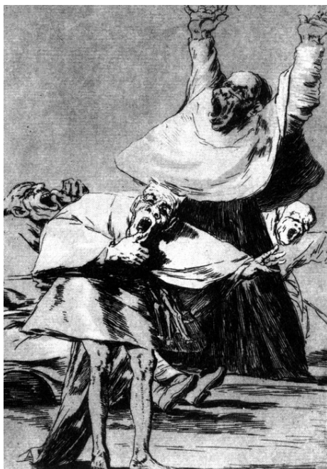
KENJARNAR Sýning á verkum Goya verður opnuð í Listasafni Reykjavíkur – Hafnarhúsi í kvöld.