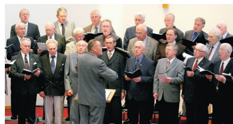
KARLAKÓR REYKJAVÍKUR Eldri félagar kórsins æfa fyrir setningu Jörvagleðinnar

Meðal annarra dagskrárliða á Jörvagleði næstu daga er opið fjór á Leiðólfsstöðum og hagrýngakvöld í Árbliki á föstudagskvöld. Síðan mun hin vinsæla