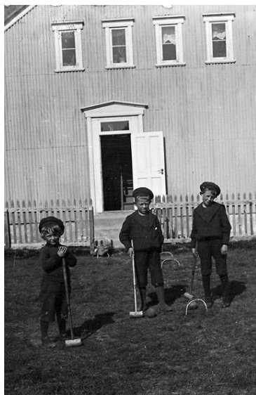
BÖRN AÐ LEIK Þrjú drengir spila krikket á fyrri hluta 20 aldar.

Þjóðminjasafnið verður opið frá klukkan 11 til 17 í dag. ■