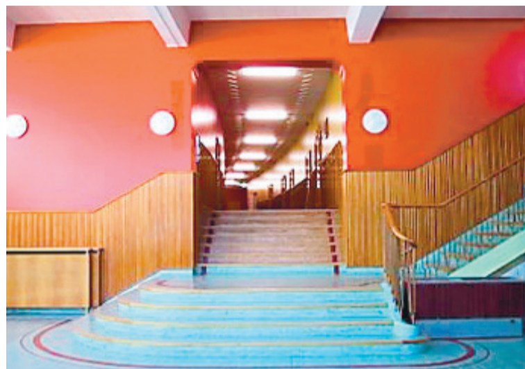
MYNDLIST Dæmi um byggingarlist á sýningunni.

fjölpjöldlegu samstarfi þar sem ákvarðanatöku er framseld til alþjóðlegra stofnana. Íslensk stjórnvöld leystu landvarnir með því að fá verktaka í Washington til að sjá um varnir landsins með varnarsamningnum 1951. Með svipuðum rökum má halda því fram að ríkisstjórn Íslands hafi með EES-samningnum frá árinu 1994 fengið verktaka í Brussel til að sjá um lagasetninguna á nokkrum mikilvægum efnissviðum.“ Hádegisfyrirlestrar Sagnfræðingafélagsins fara fram í fyrirlestrasal Þjóðminjasafnsins og standa frá klukkan 12.05 til klukkan 12.55. Upplýsingar um hádegisfyrirlestra má finna á heimasíðu Sagnfræðingafélagsins: www.sagnfraedingafelag.net - pbb