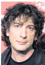
Sigursæll Neil Gaiman.

NEIL Gaiman, hinn kunnibreski víndaskáldsögu- og myndasagna-höfundur, fékk Hugo-verðlaunin á sunnudaginn fyrir Kirkjugarðsbókina eða The Graveyard Book . Verðlaunin