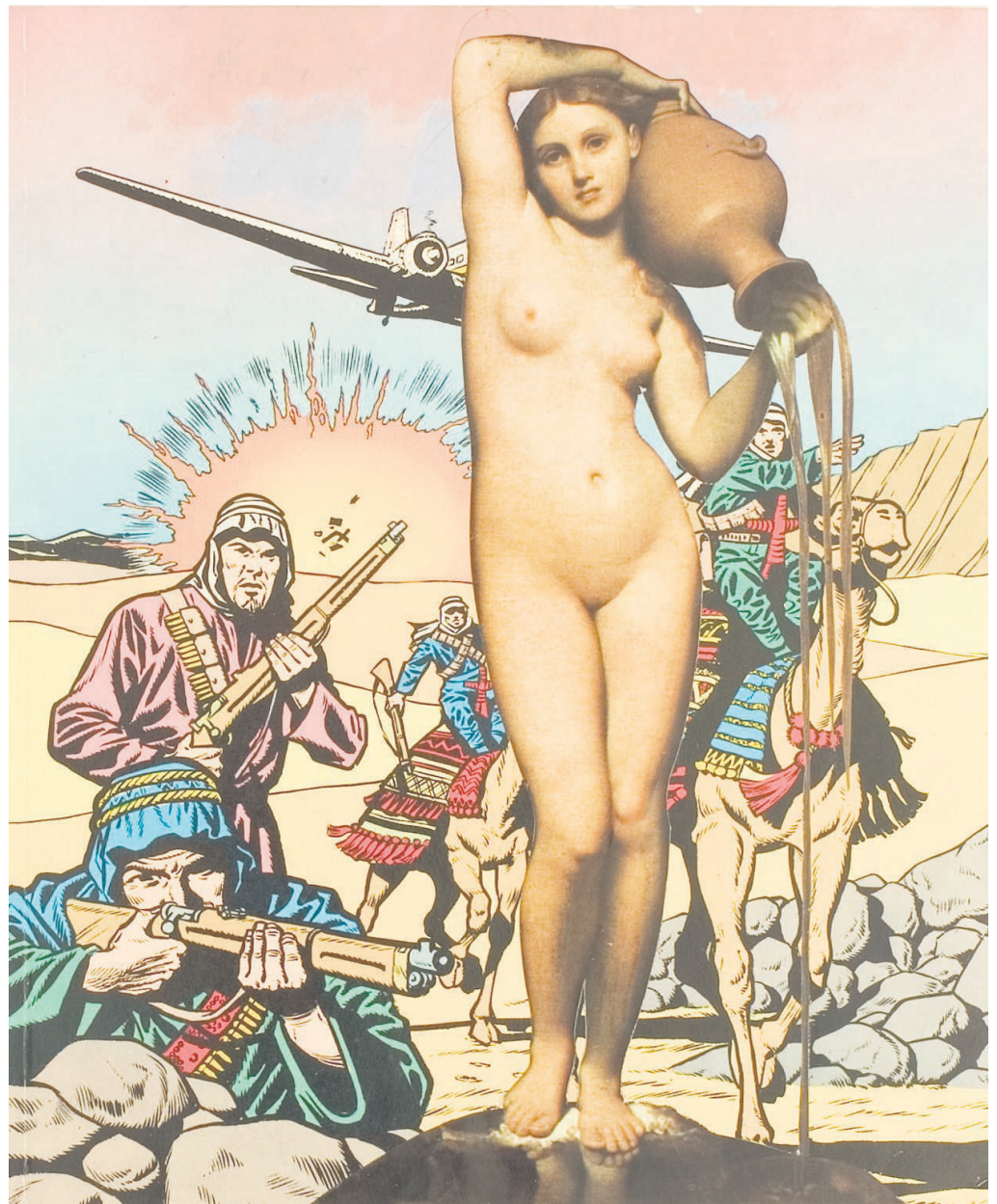
Klippimyndir Ein af klippimyndum Errós sem sýnd verður í Listasafni Reykjavíkur.

Klippimyndir Erró voru yfirlétt skapadár í