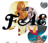
GRAFÍK FRÁ FÆREYJUM Í SAL GRAFÍKÉLAGSINS