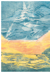
Verk eftir Dröfn