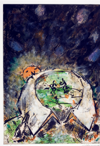
Skyrtudalur (Shirt -Walley) eftir Christian Ludwig Attersee frá 1994.