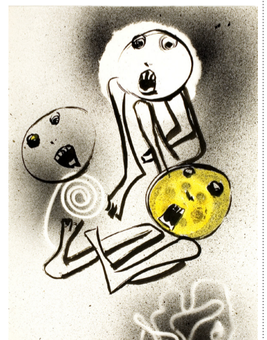
Erró. Án titils/Untitled [úr seríu Les Carcasses/Beinagrindurnar (1955-1957)], 1955.