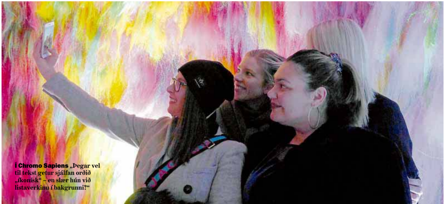
Í Chromo Sapiens „Þegar vel til tekst getur sjálfan orðið „fkonísk“ – en slær hún við listaverkinu í bakgrunni?“

Mikil umræða hefur skapast um áhrif þessarar nýju listreynslu á