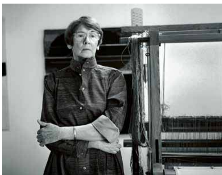
Ásgerður árið 1991 Í desember var öld frá fæðingu veflistakonunnar Ásgerðar Þíðadóttur. Áhrifarík yfirlitssýning á verkum hennar var á Kjarvalsstöðum og í Listasafni Íslands sýning á veflistarverkum henni til heiðurs.