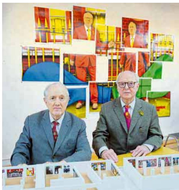
Gilbert & George Listamennirnir frægu eru hér á vinnustofunni í London við módelið að The Great Exhibition í Listasafni Reykjavíkur, sýningu sem þeir hafa ekki séð en stendur enn.