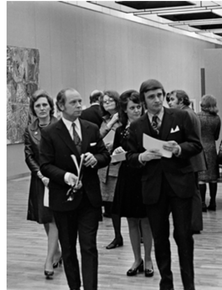
05 Mynd