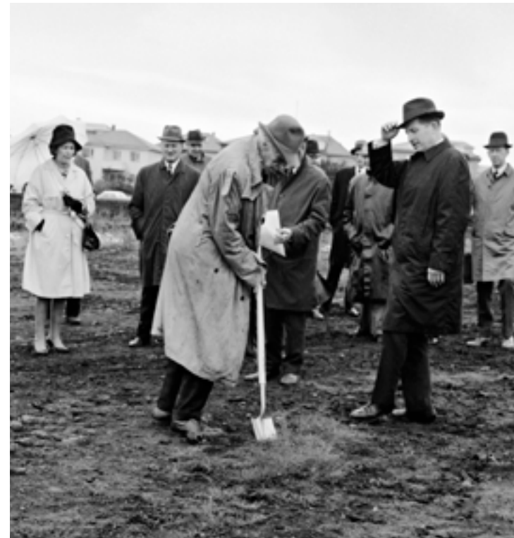
02 Mynd

18 August 1966. Artist Jóhannes Kjarval and Mayor Geir Hallgrímsson converse as ground is broken for Kjarvalsstaðir.