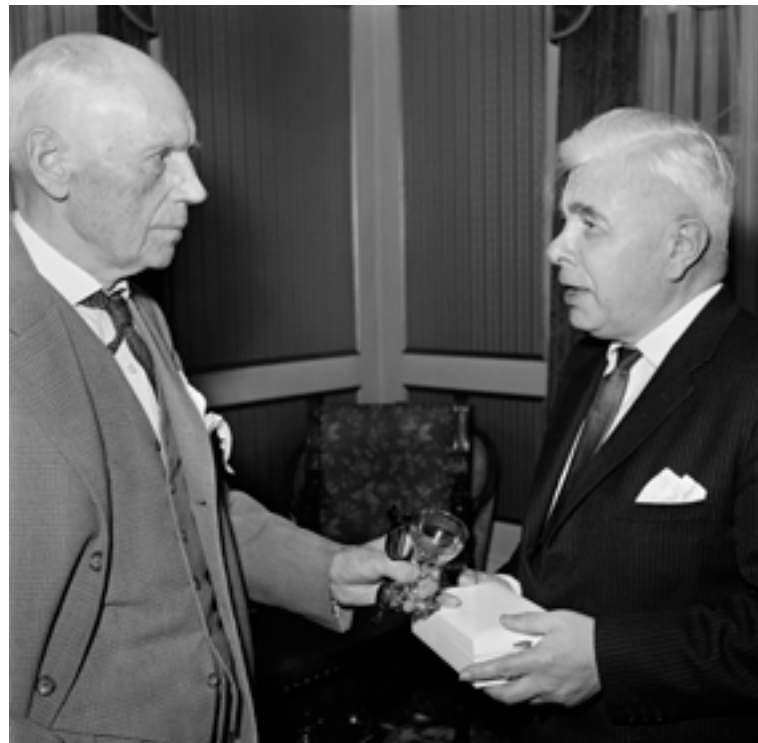
01 Mynd

This photo is taken 15 October 1965, when the Minister for Education hosted a party in honour of painter Kjarval on his eightieth birthday. It shows prime minister Bjarni Benediktsson and the guest of honour, Jóhannes S. Kjarval, where the latter is declining the Order of the Falcon. On this same day, he was also promised a villa in Seltjarnarnes and that Kjarvalsstaðir would be built.