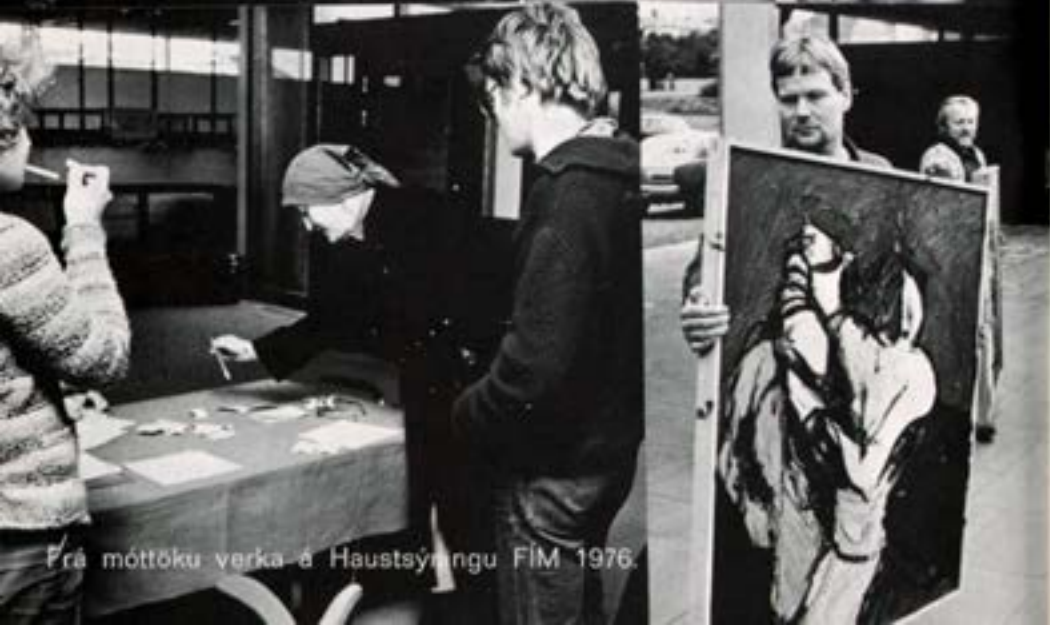
Frá móttöku verka á Haustsýningu FIM 1976.