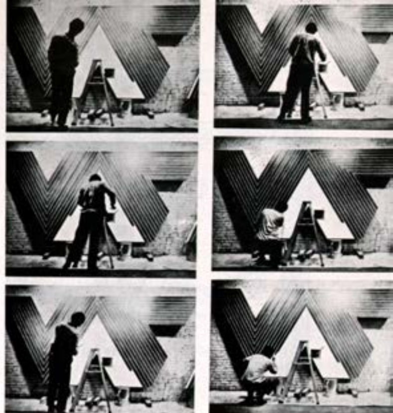
Frank Stella við vinnu.