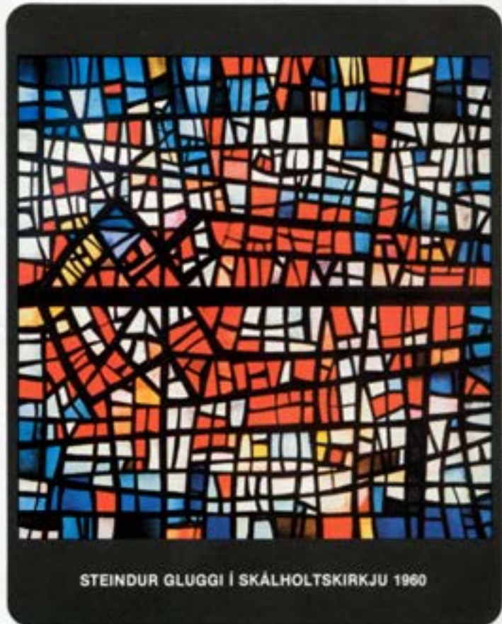
STEINDUR GLUGGI Í SKÁLHOLTSKIRKJU 1960

Undir lok sjötta áratugarins var Gerður tekin að vinna listaverk úr steindu gleri og blívi og síðar úr gleri og steypu, sem tók mikið af hennar tíma næstu árin. Enda prýða steindir gluggar hennar fjölmargar kirkjur í Þýskalandi og í Frakklandi, svo og hér á landi. Voru Skálholtskirkjugluggarnir með fyrstu stórverkum af því tagi á árinu 1959. Þar með hófst samvinna hennar og hins þekktu listiðnaðarverkstæðis Oldtmansbræðra, sem stóð í raun fram yfir lát hennar. Og hafa þeir bræður unnið steinda glugga eftir Gerði, sem sjást í fyrsta sinn hér á sýningunni og eru í eigu Menningar- og listasafns Kópavogs.