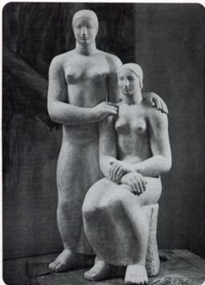
TVÆR SYSTUR, ÆSKUVERK FRÁ 1947