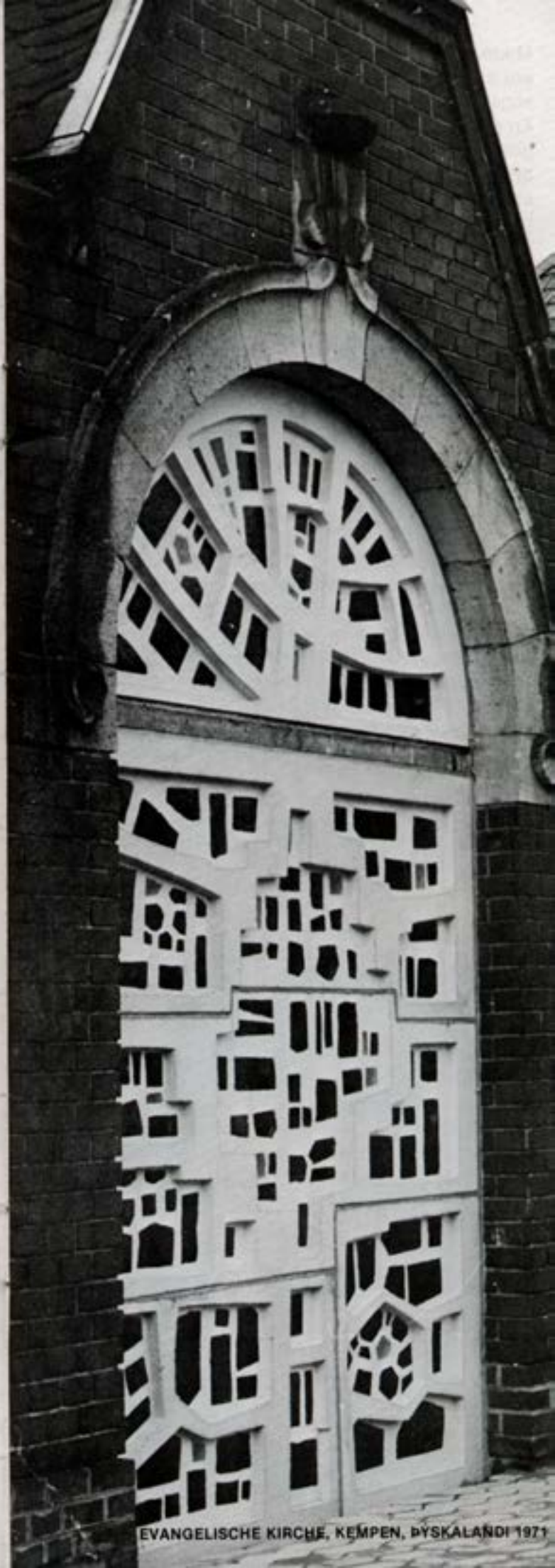
EVANGELISCHE KIRCHE, KEMPEN, ÞYSKALANDI 1971