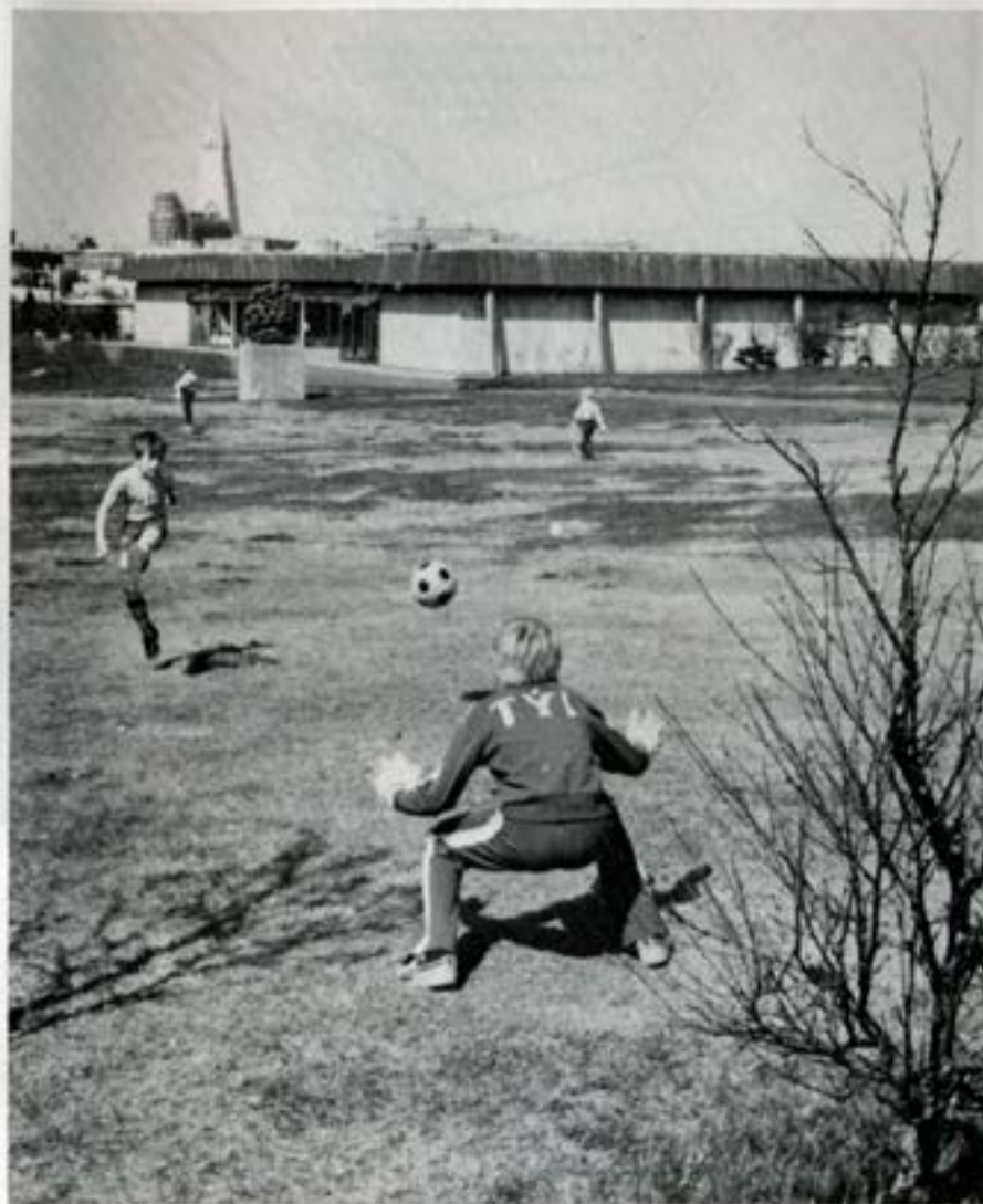
RITSTJÓRN SKRÁR: Þóra Kristjánsdóttir LJÓSMYND AF KJARVAL: ljósmyndari okunnar ÚTLIT SKRÁR OG AÐRAR LJÓSMYNDIR: Björn Rúníksson ENSK ÞÝÐING: Hilmar Foss SETNING, PRENTUN OG BÓKBAND: Prentsmiðjan Hólar hf.