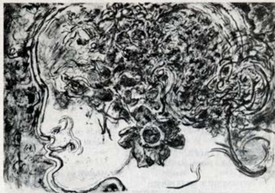
Blómandlit 35,5×40,5 Svart blek