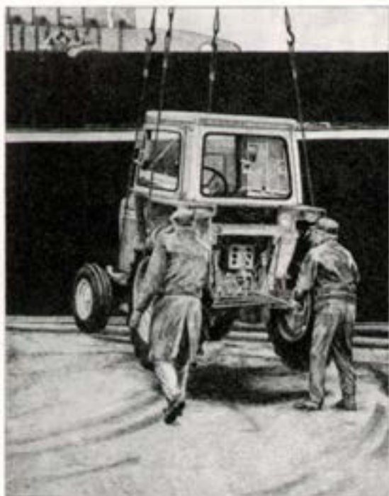
Uppskipun við höfnina