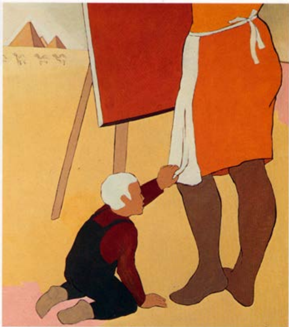
Komdu heim, 1983, olía, 100×90 cm.