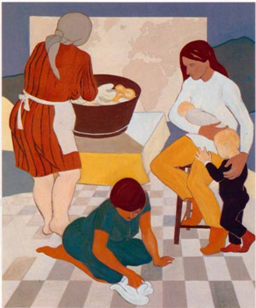
T.d. María mey, 1982, olía, 120×100 cm.