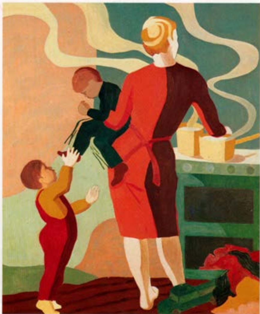
Milli kl. 6 og 7, 1981, olía, 120×100 cm.