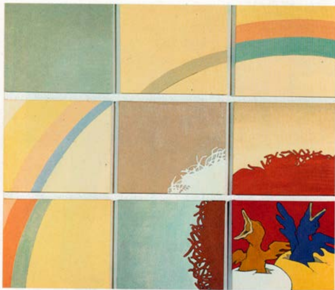
Undir regnboganum, 1983, olía, 95×110 cm.