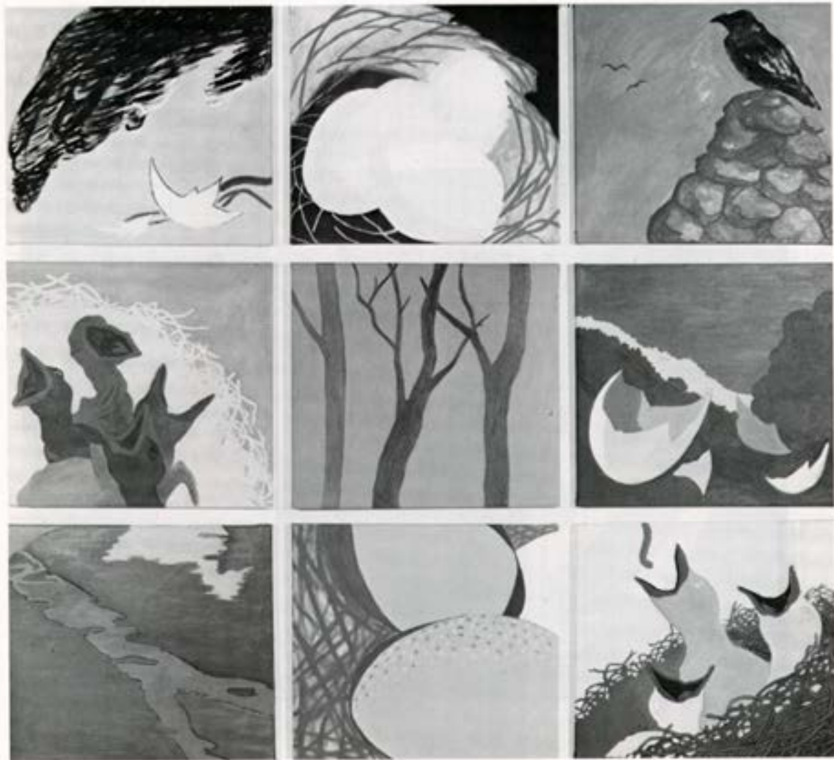
Alla étíð hafði þá . . ., 1981, olía, 158×173 cm.