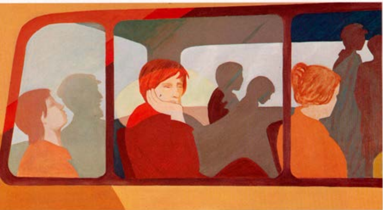
Strætó, 1981, olía, 65×120 cm.