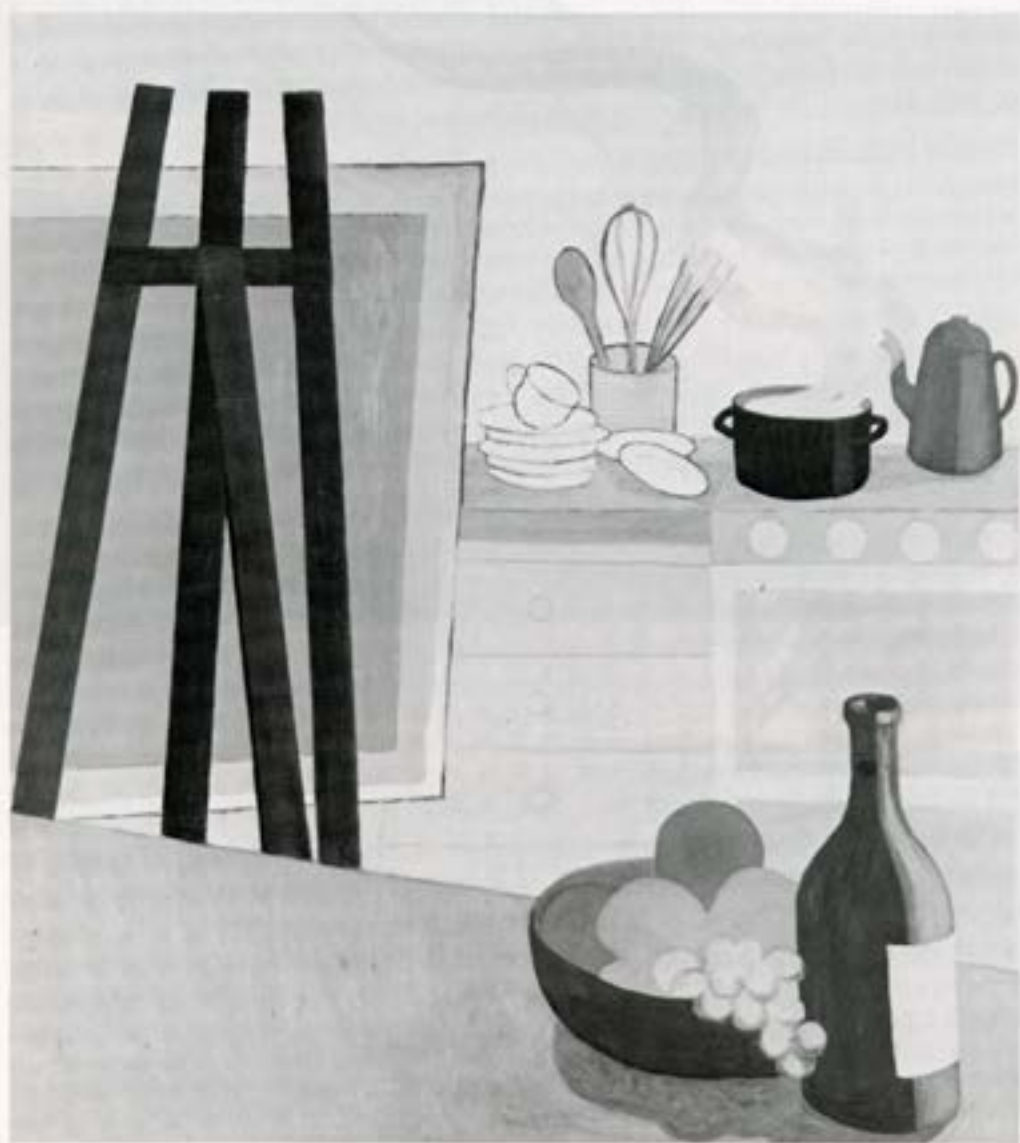
Byrjunin, 1983, olía, 100×90 cm.