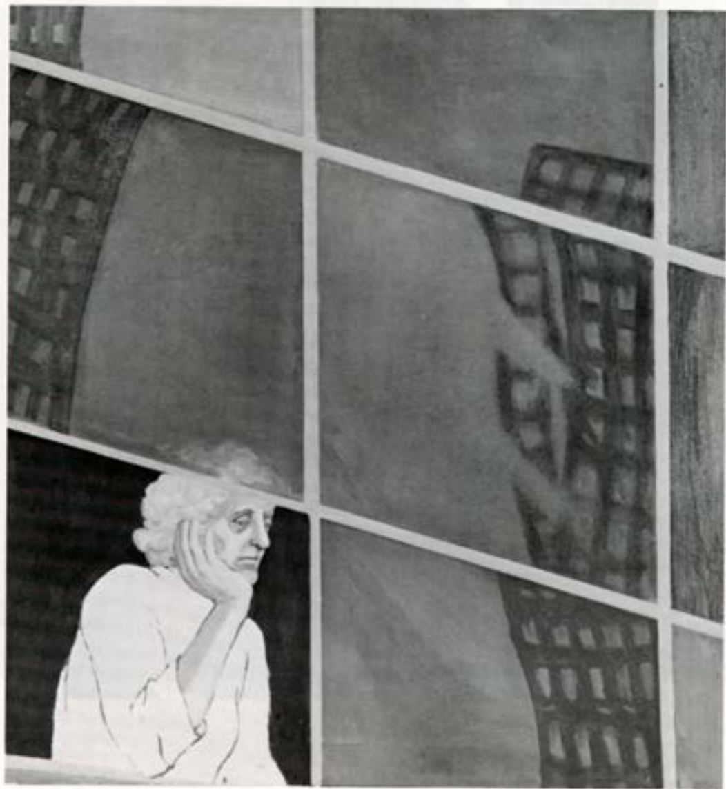
1/1.000.000, 1981, olía, 70×65 cm.