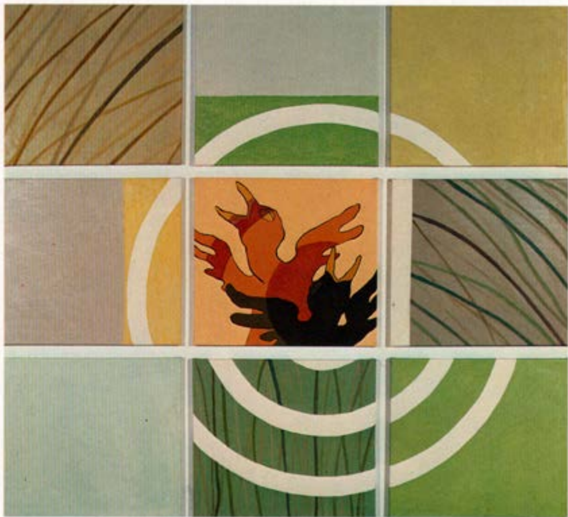
Örlög, 1983, olía, 158×173 cm.