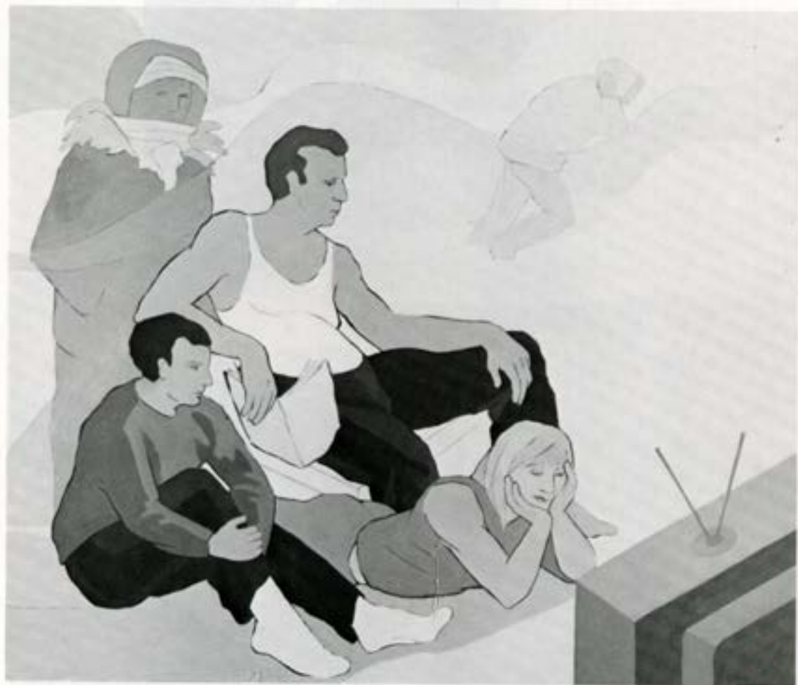
Skammdegi, 1983, olía, 100×120 cm.