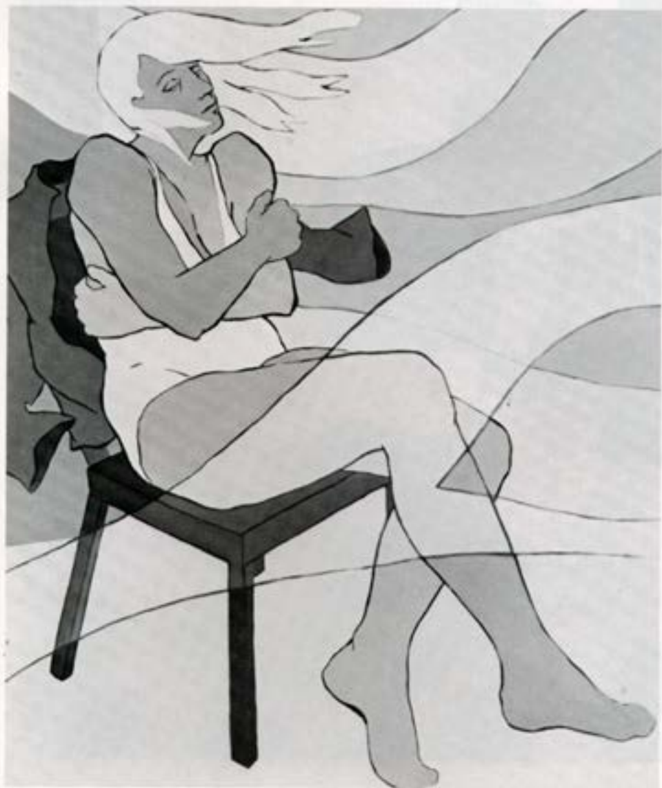
Gustur, 1983, olía, 120×100 cm.