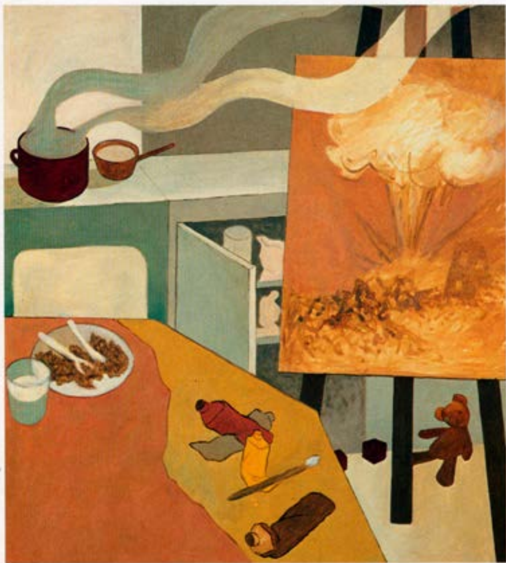
Nær og fjær, 1983, olía, 100×90 cm.