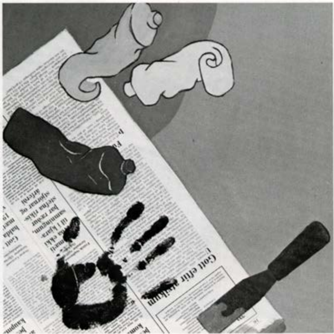
Vinnustofulif I, 1982, blönduð tækni, 45×40 cm.