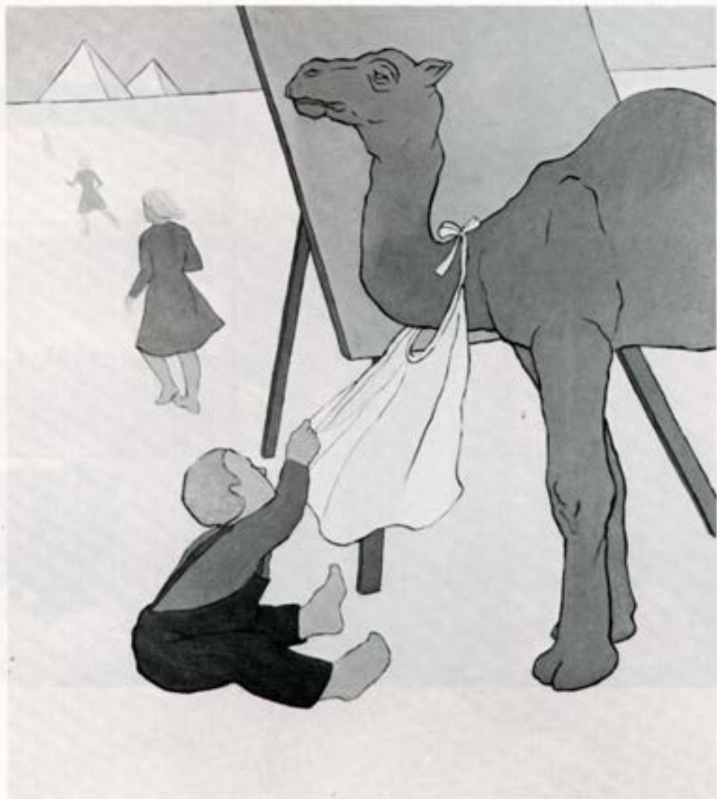
Hvar ertu?, 1983, olía, 100×90 cm.