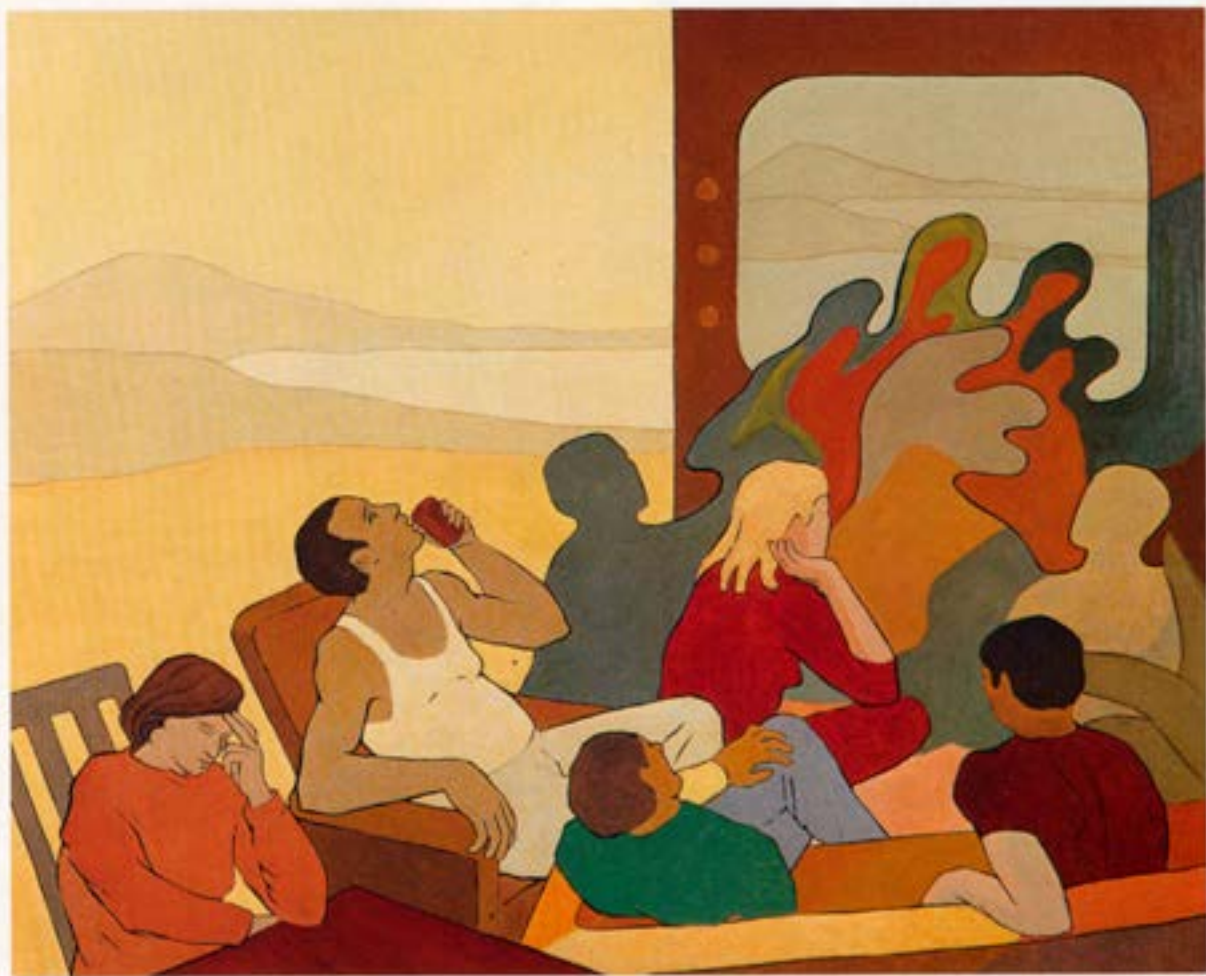
Sól skín á heiði, 1983, olía, 120×140 cm.