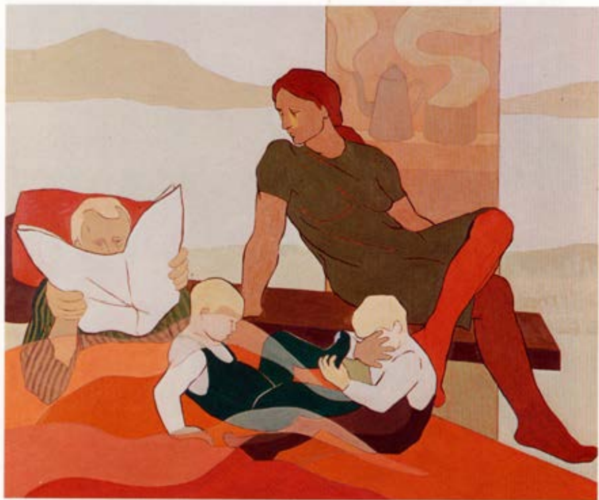
Hvildardagur, 1983, olía, 100×120 cm.