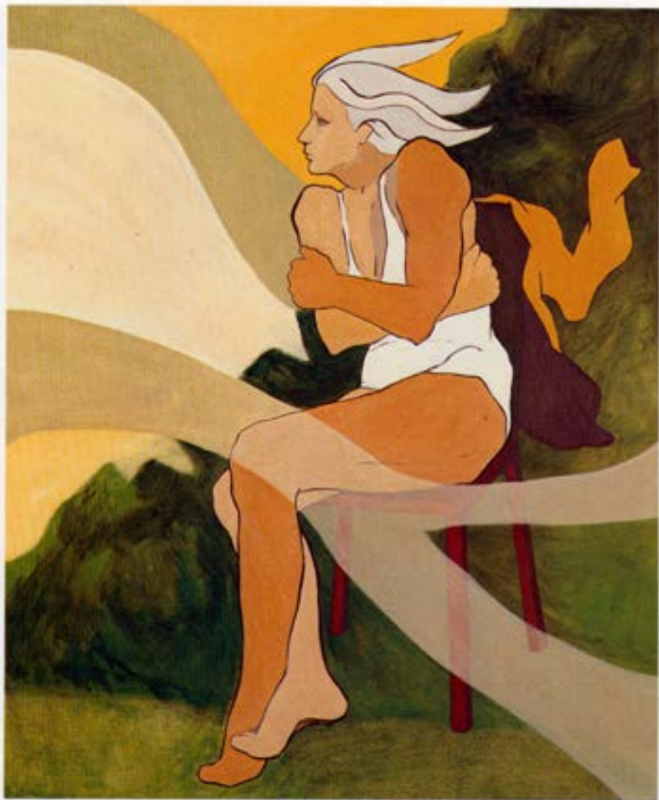
Í leit að sumri, 1983, olía, 120×100 cm.