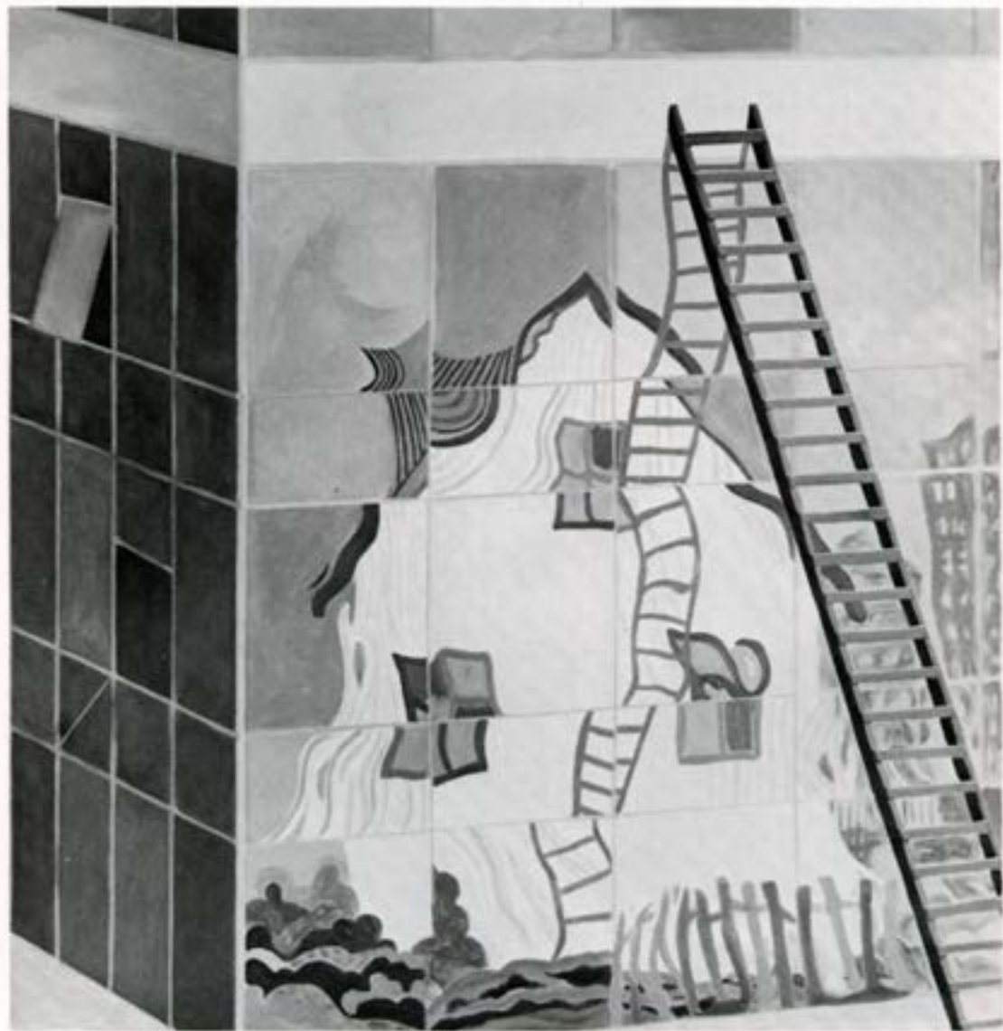
Speglnun, 1981, olía, 90×80 cm.