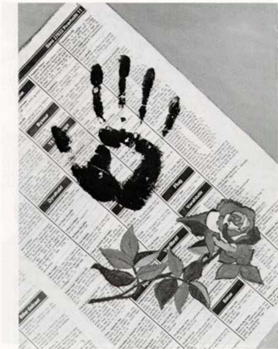
Vinnustofulif II, 1982, blönduð tækni, 40×30 cm.