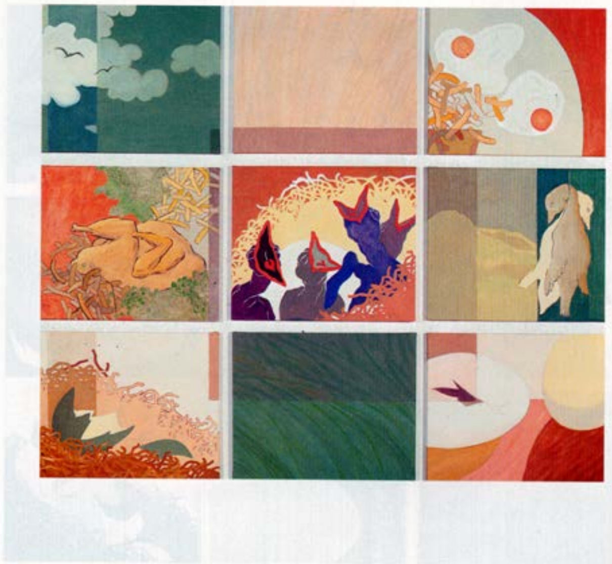
Fuglalíf, 1983, olía, 158×188 cm.