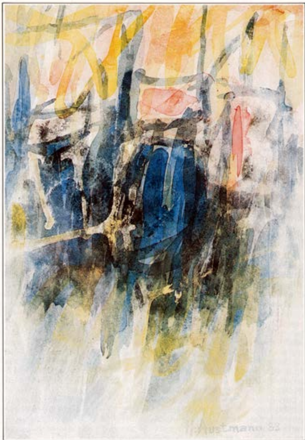
Rjóður 1983 Vatnslitur 41 x 28 cm Clearing 1983 Water colours 41 x 28 cm