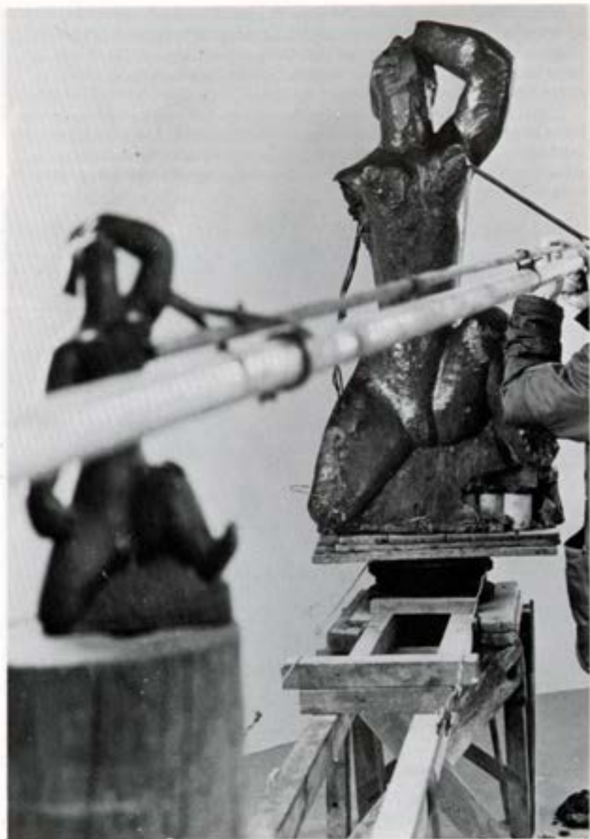
Stækkunartæki og tvær stærðir af verkinu Vor.