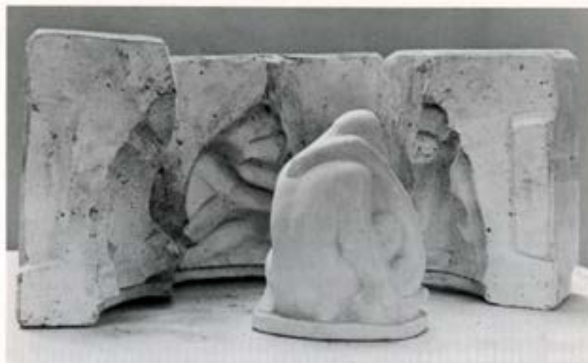
Gifsmót og stytta Jónsmessundt.