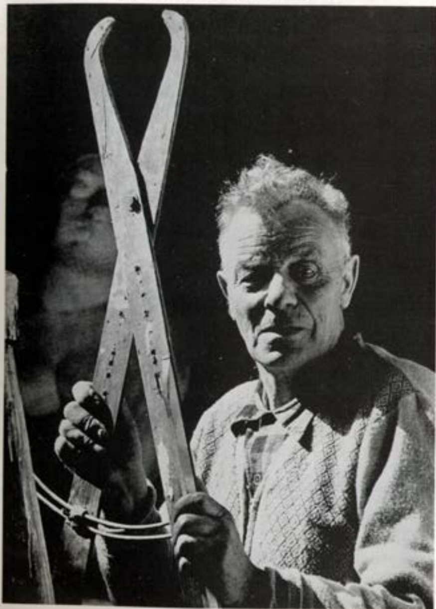
Vinnan í list Ásmundar Sveinssonar