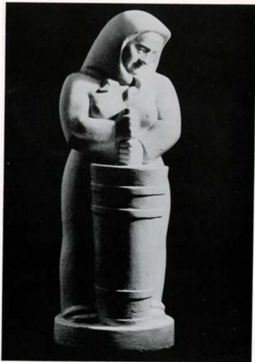
Kona að strokka, 1934.