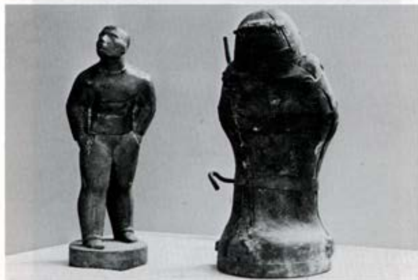
Jármót og stytta Veðursþámaður.

Mót eru form sem notuð eru til að endurmóta og framleiða eins eða fleiri eftirmyndir af frummynd. Mót geta verið úr margs konar efnum en hér á sýningunni gefur aðeins að litla mót úr gílsi, leir og jámi. Ásmundur hjó litlið í stein eða