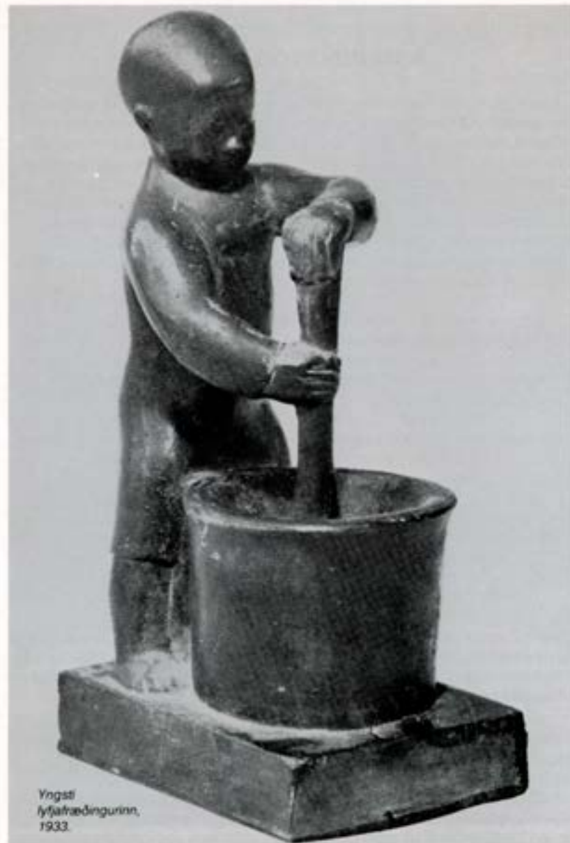
Yngsti lyfjafræðingurinn, 1933.