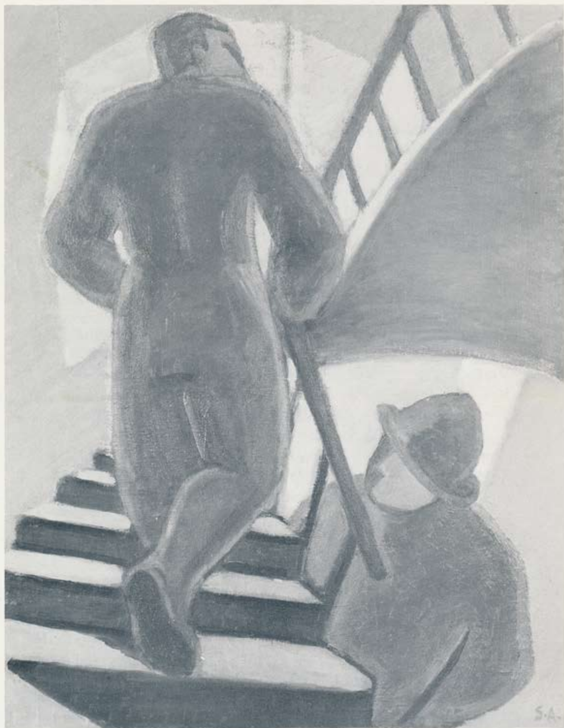
Upp þrepin olía 1942