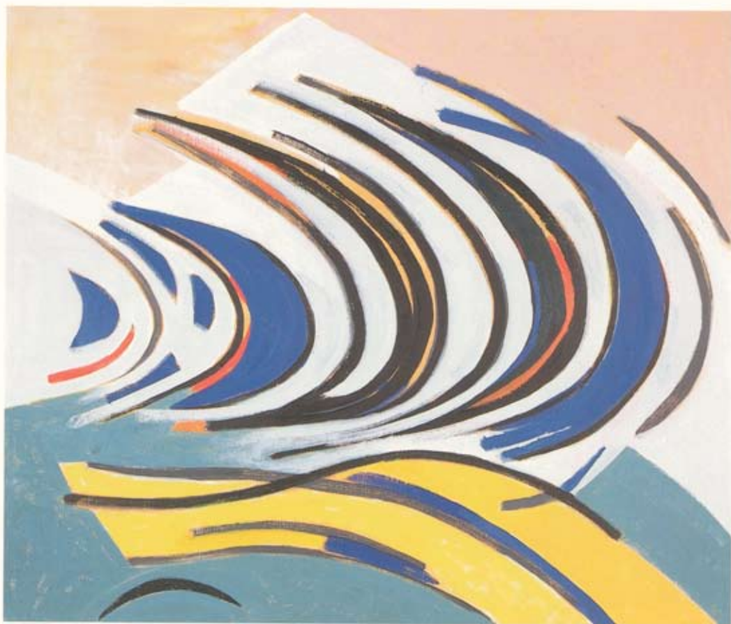
Þorvaldur Skúlason Snöggleiftur 1977 80 × 90