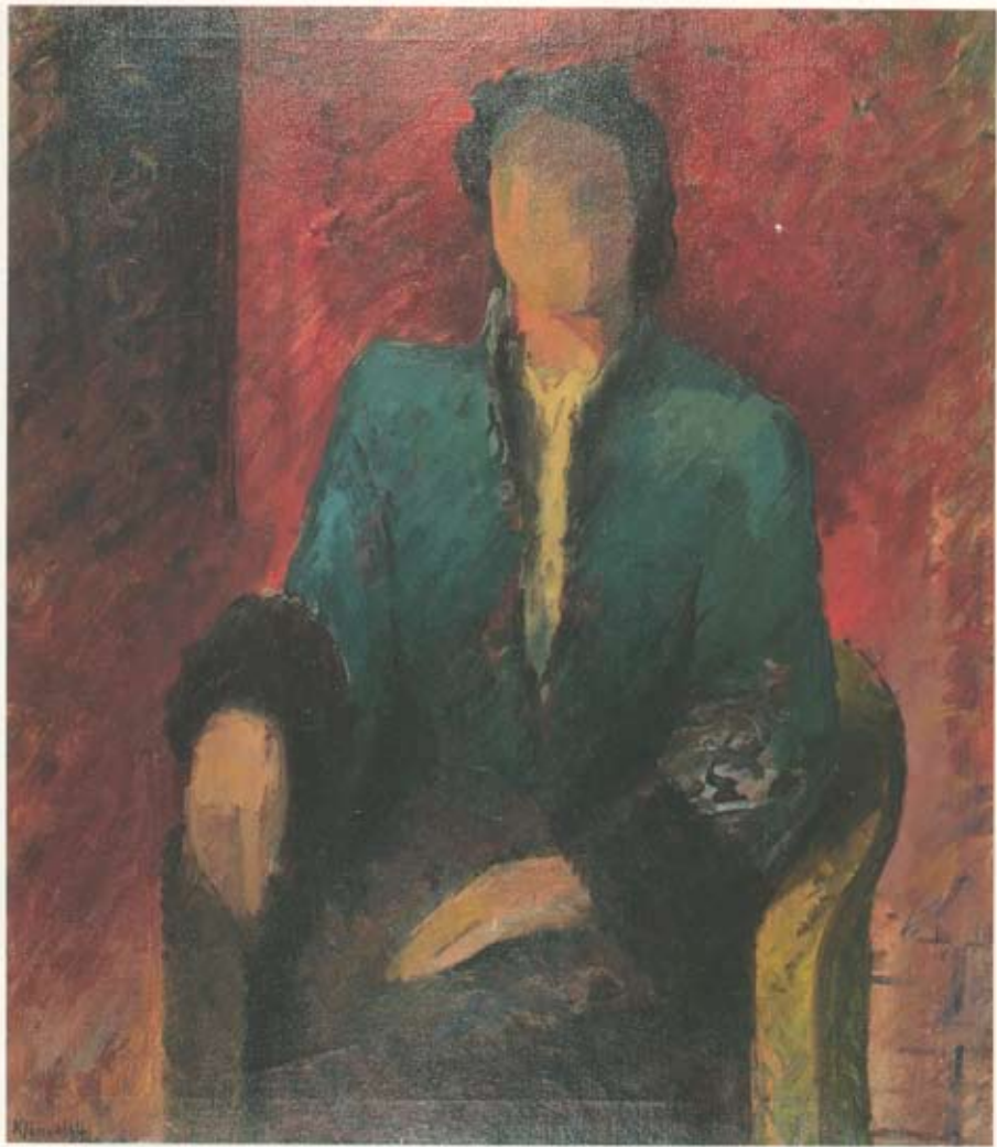
Kristín Jónsdóttir Kona 75 × 65