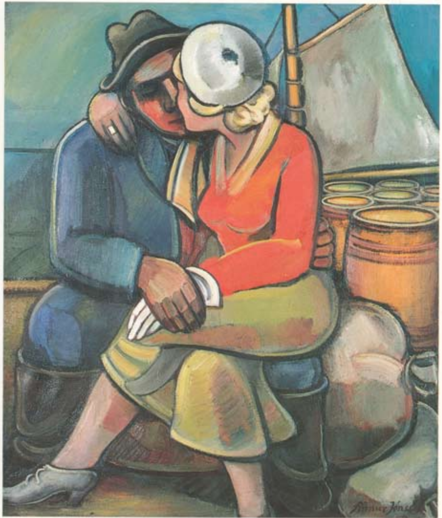
Finnur Jónsson Sildarrómantik 110 × 95