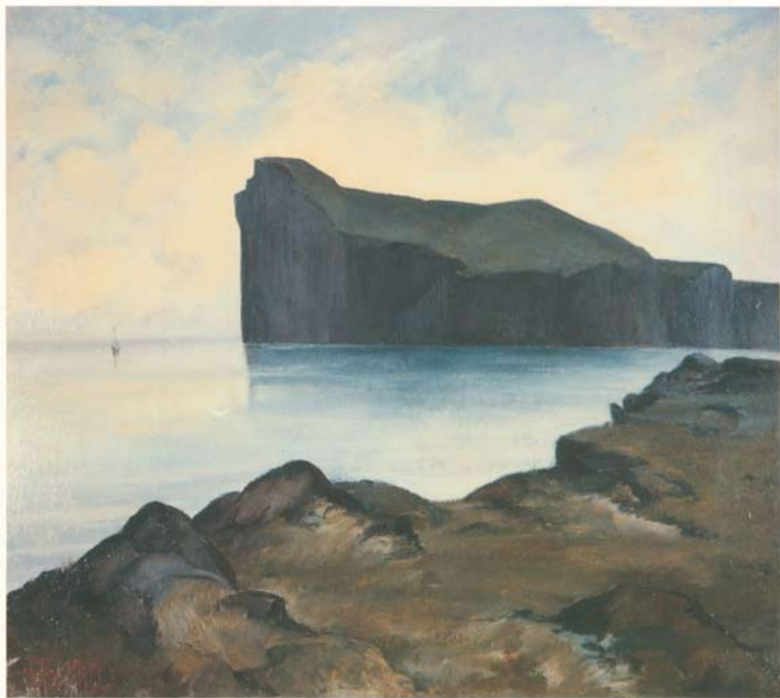
Muggur (Guðmundur Thorsteinsson)