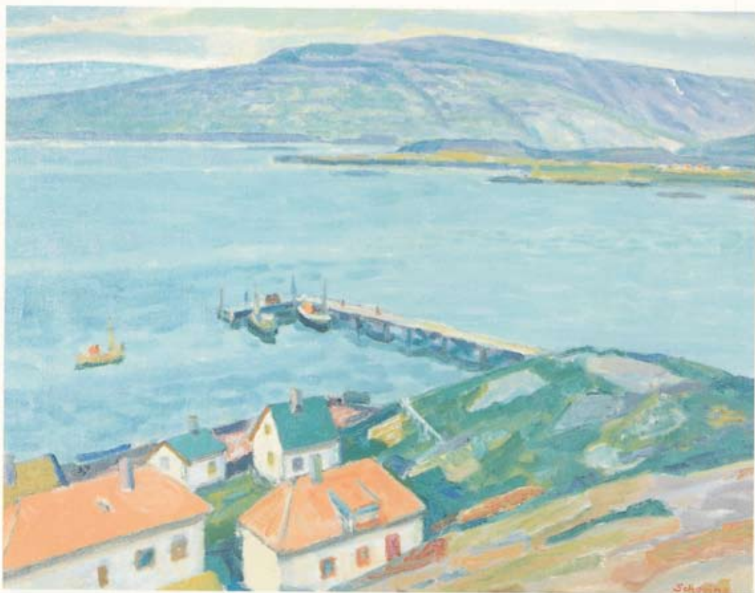
Gunnlaugur Scheving Við fjörðinn 60 x 75