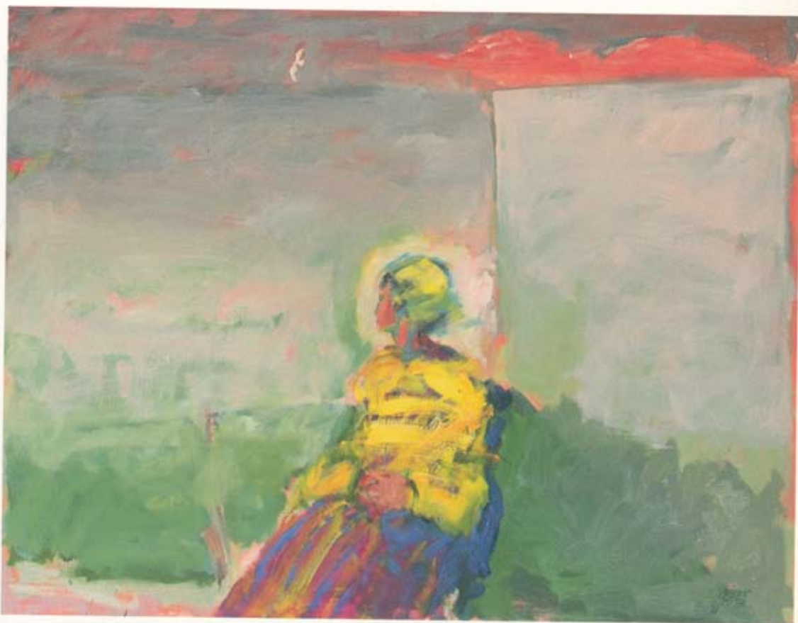
Eiríkur Smith Vormorgunn 1988 100 × 130