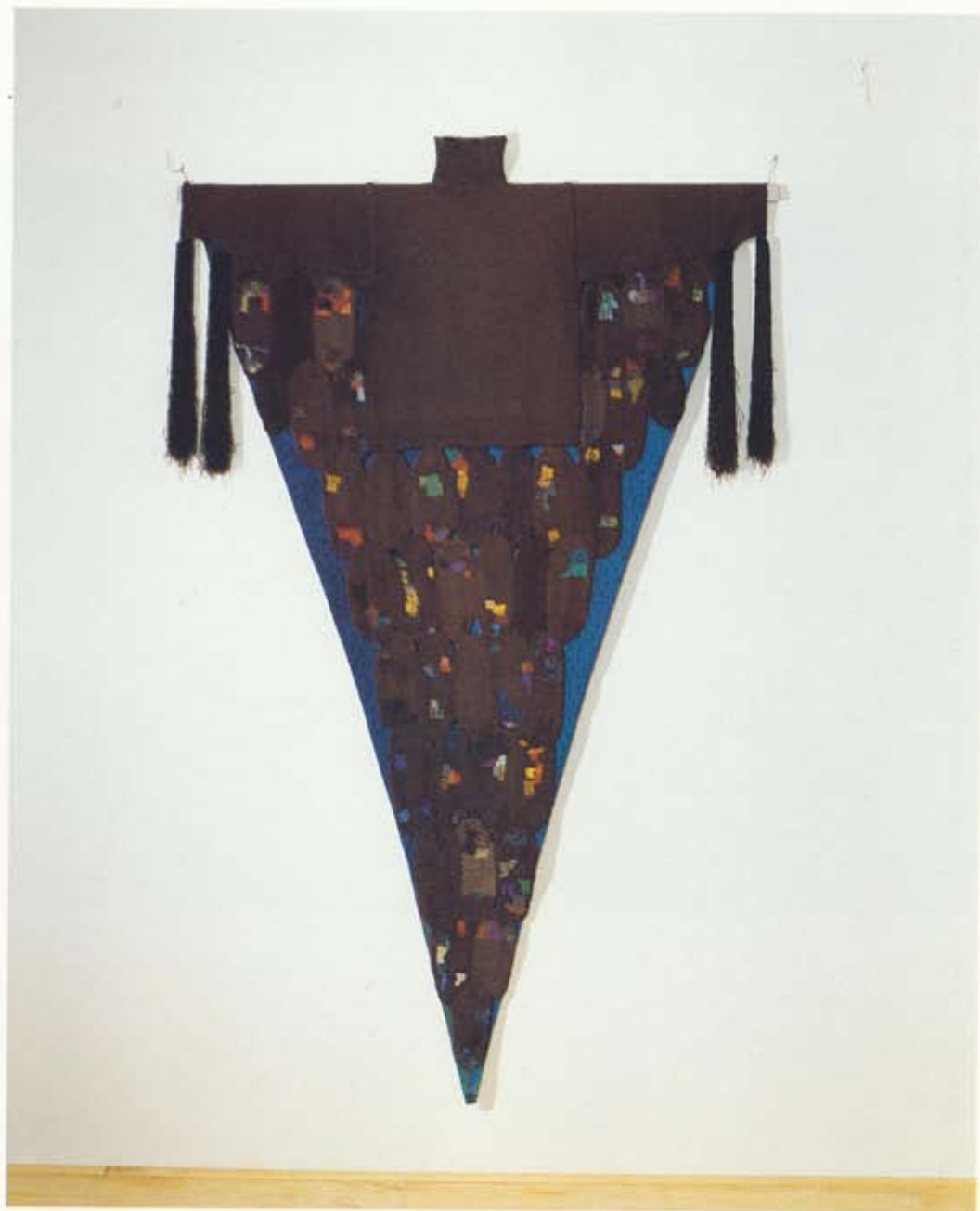
Astrid Andreassen Bóndinn / Bóndin , 1998 Prjónað / Búndið og stoppað , um 170 x 200 cm