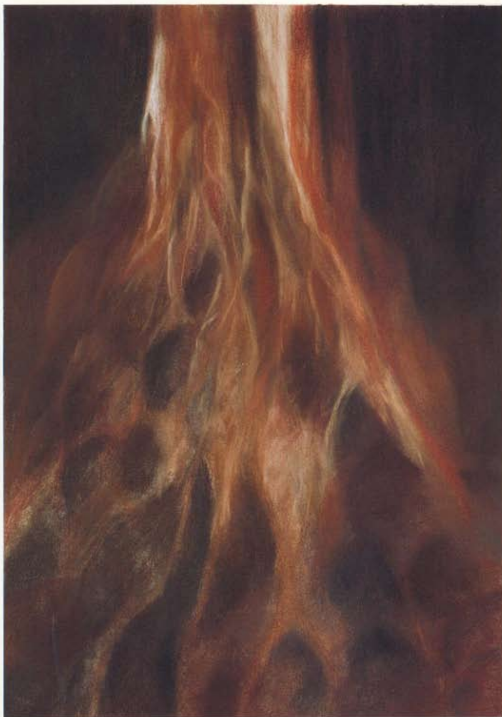
Rannvá Kunoy Rannsókn hins innra, II Rennsli/ Kanning av tí innara, II Rensl , 1998 Rauðkrít / Reyðkrít 140 x 100 cm