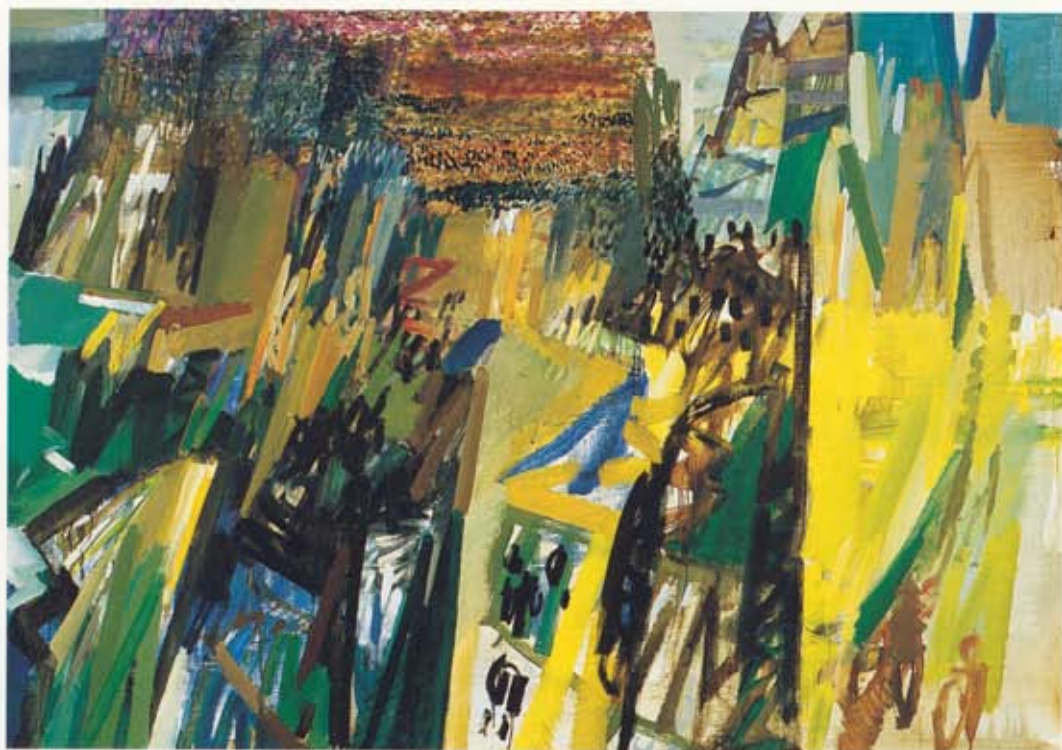
Bárður Jákupsson Hesperísk strönd 3 / Hesperisk Strond 3 , 1997 140 x 200 cm