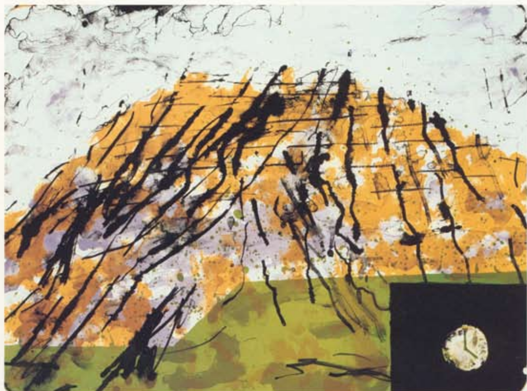
Marius Olsen Síðdegis, Malinsfjall / Seinnapartur, Malinsfjall Steinprent, 50 x 66 cm