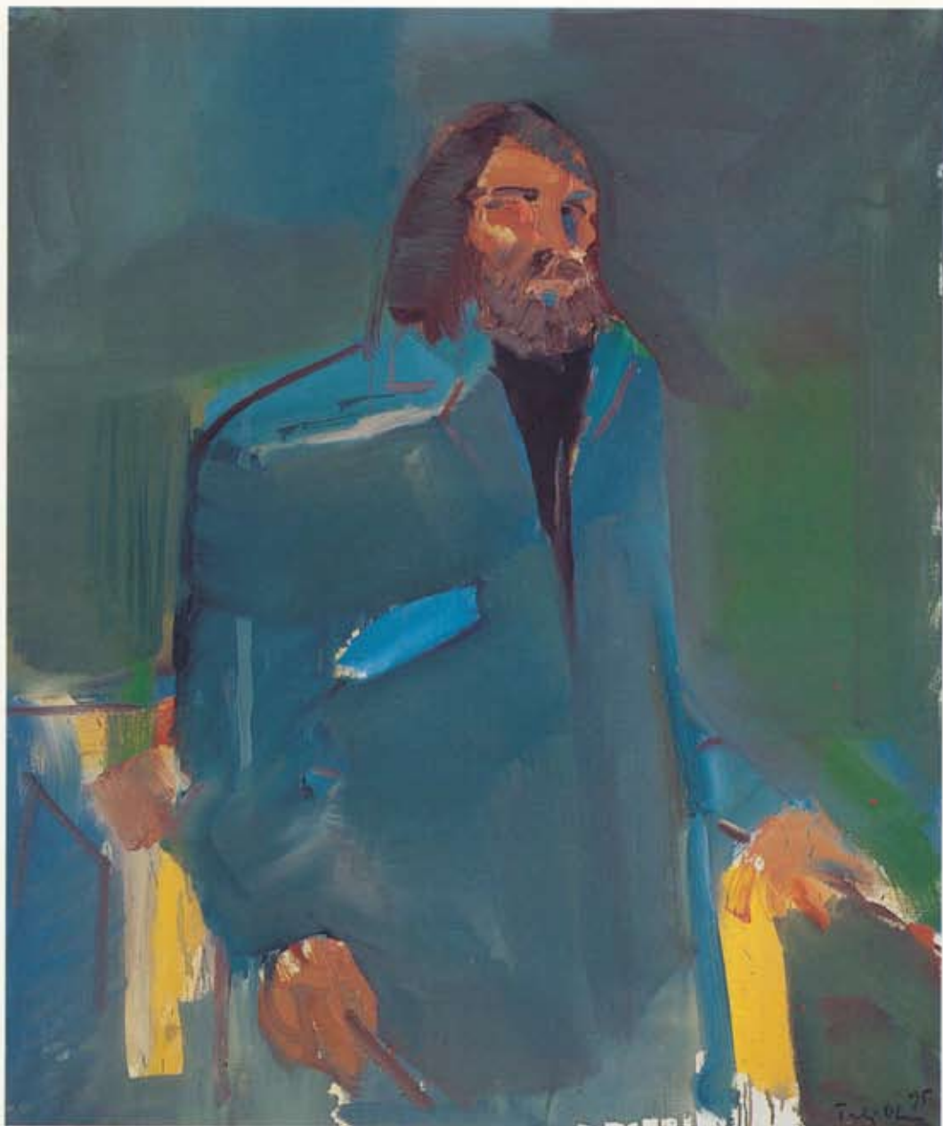
Torbjörn Olsen Sjálfsmynd / Sjálfsmynd , 1995 120 x 90 cm