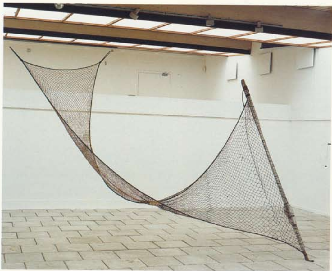
Tita Vinther Pétursnót / Pétursnót , 1998 Blönduð tækni / Blandað tækni