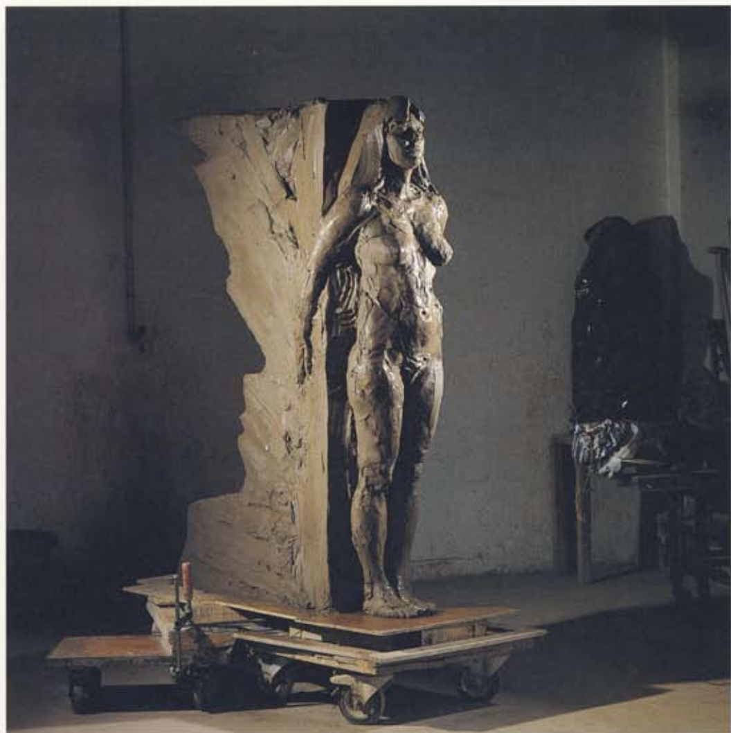
Hans Pauli Olsen Hjördis og skugginn / Hjördis og skuggin , 1993 Trefjagler / Glastrevja , 200 x 140 x 48 cm