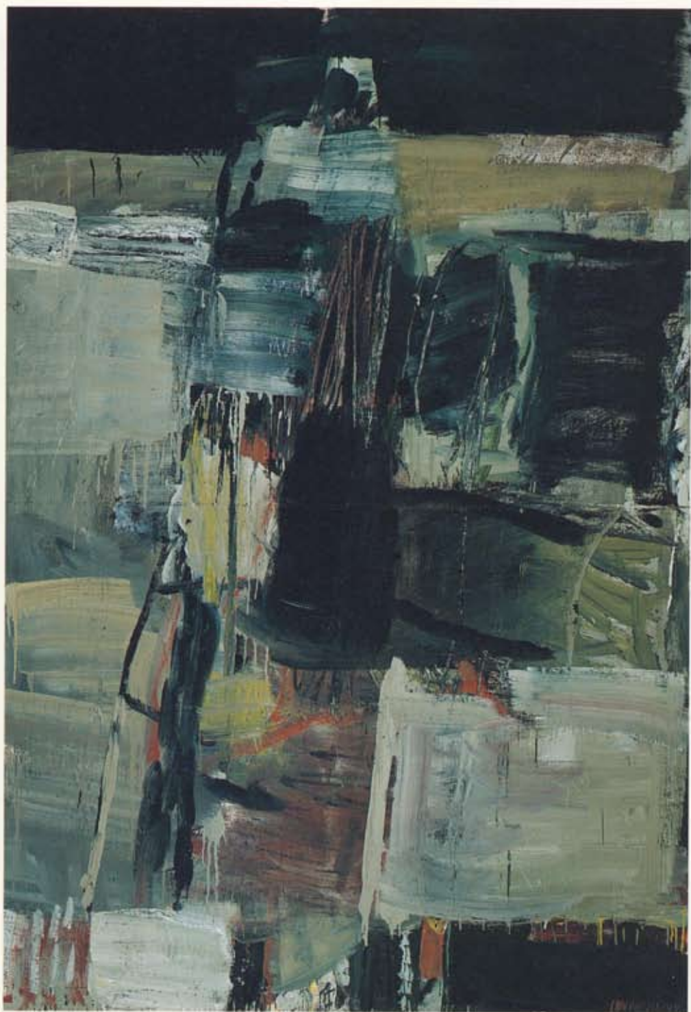
Ingálvur av Reyni Stúlka / Genta, 1995