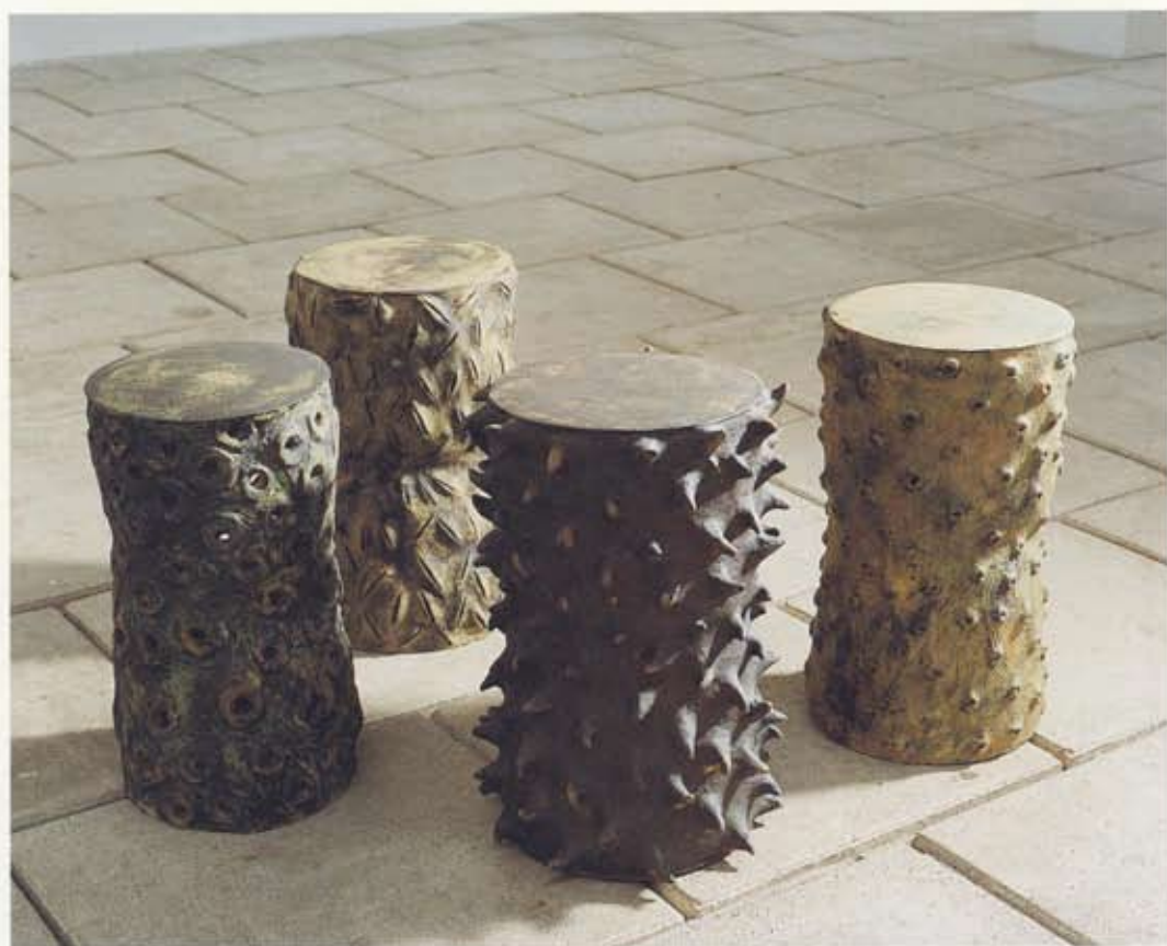
Guðrið Poulsen Samræður 1-6 / Samrøða 1-6 , 1998 Steinleir/ Steintoysleir , um 25 x 60 cm