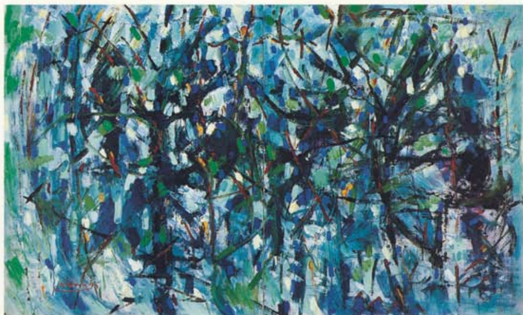
Amariel Nordoy Vetrarmorgunn, Vestmanna / Vetrarmorgun, Vestmanna , 1995–98 80 x 130 cm