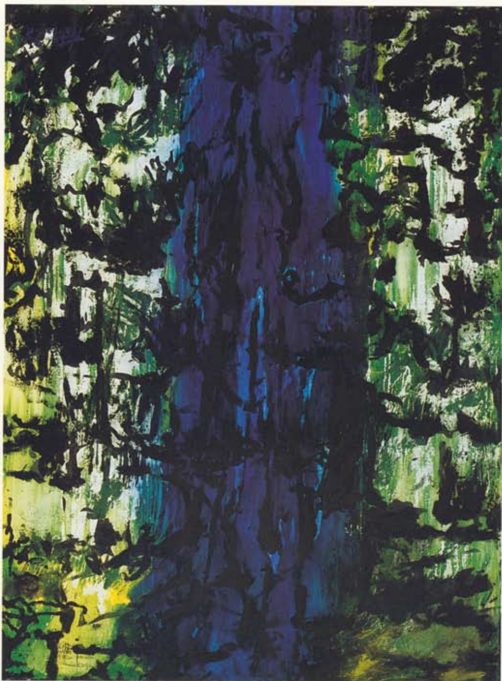
Tróndur Patursson Náttúrulýsing / Náttúrulýsing , 1997 Tempera