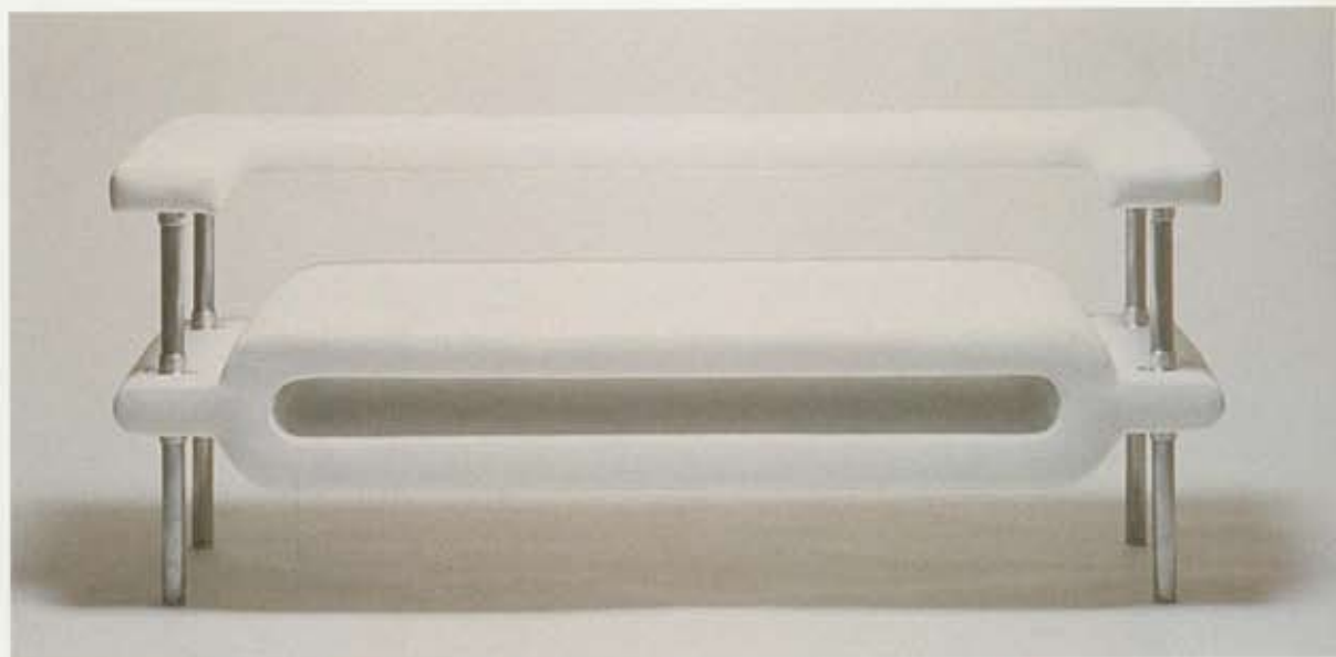
03 magazine sofa manufactured by my022. 04 my studio vase. 05 my studio flatlight. 06 rim table manufactured by cambria chrome. 07 fly sofa manufactured by e&y