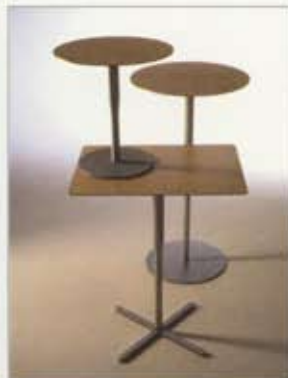
03 atlas system manufactured by alias