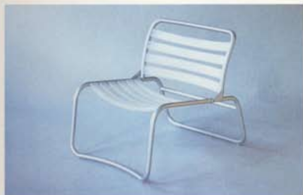
06 lima manufactured by cappellini

The following publications contain major articles on the projects mentioned above: Domus N°694, May 1988; Ottagono N°100, September 1991; Casa Vogue N°243, Jul/Aug 1992; Domus N° 742, October 1992; Ottagono N° 106, March 1993; Domus N° 762, Jul/Aug 1994; Architecture D'Aujourd'hui N° 300, September 1995; Ottagono, March 1996; Design Report (Stadtbahn 2000), July 1996; Abitare, Jul/Aug 1996; Domus N° 798, November 1997; I.D. March/Apr 1998; Bauwelt, June 1998.