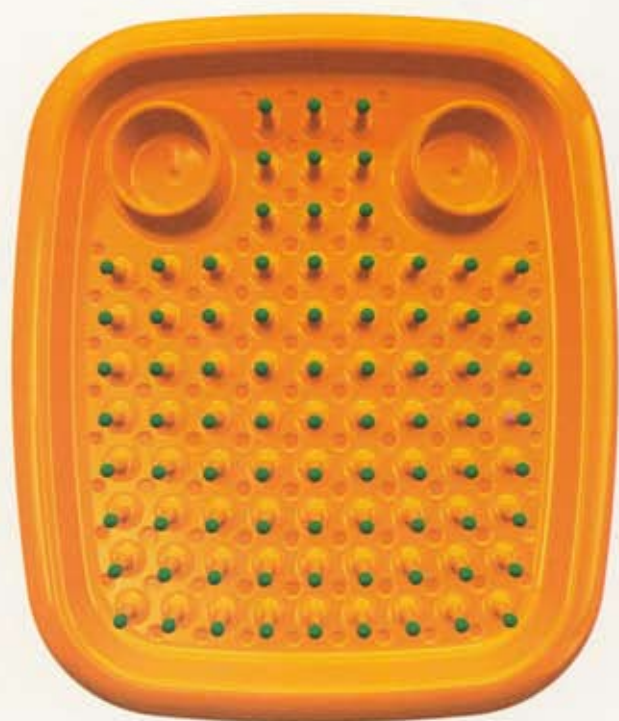
04 dish doctor manufactured by magis