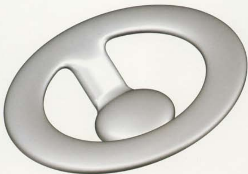
06 towel hook manufactured by Alessi