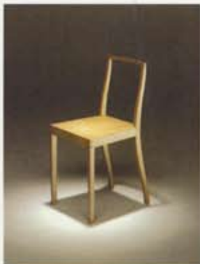
02 ply chair manufactured by vitra