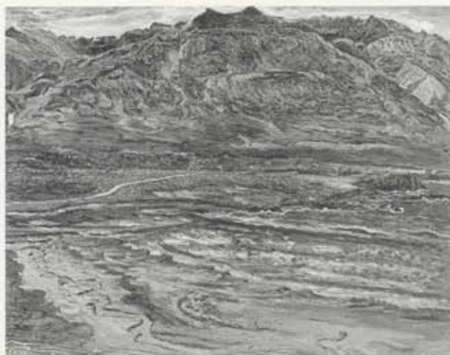
Heimahagar, 1948, olía á striga, 130 x 160 cm, Kjarvalsafn