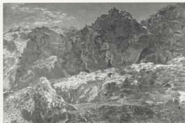
Úr Gálgahrauni, 1950, olía á striga, 105 x 155 cm, einkaeign