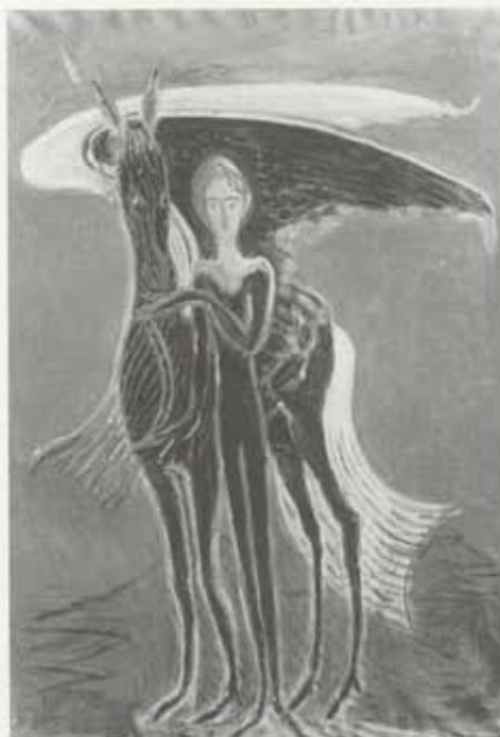
Pegasus og stálkan, 1953, olía á striga, 70 x 103 cm, einkaeygn

taka eftir ljóðunum sínum. Var aldrei eins gláður og þegar hann fór með ljóð eftir sig og maður hlustaði eins og fastur aðdáandi. 12