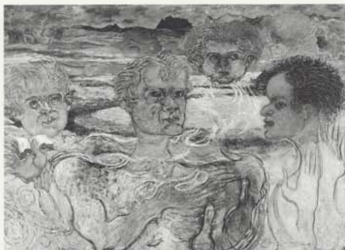
Lesið úr Gullbók, 1960, olía á striga, 150 x 204 cm, einkaeign