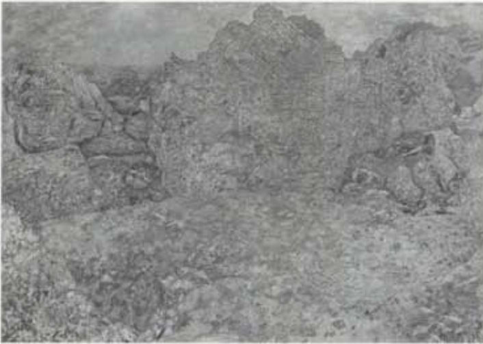
Gálgahraun, 1961, olía á striga, 105 x 152 cm, einkaeign

ir okkur heillandi hugmynd sína um tilurð hraunsins sem bylgjast áfram í mannsmynd og nær með undraverðum árangri að sýna hreyfingu í kyrrstöðu. Kjarval setti einnig fram hugmyndir um endurvarp hljóðs í hrauninu: Hugsid ykkur hraungig sem straumurinn rennur frá í margar áttir. Hann er fyrst og fremst útvarpsstöð. Hraunstraumarnir storkna, og taka á móti áhrifum allsstaðar að í þúsundir ára. Svo endurvarpa þeir. Ég hef heyrt margskonar hljóð úti í hrauni. Öll náttúran er eitt spilverk, allsaman músik. Maður er svo móttækilegur fyrir músik úti í hrauni. 24