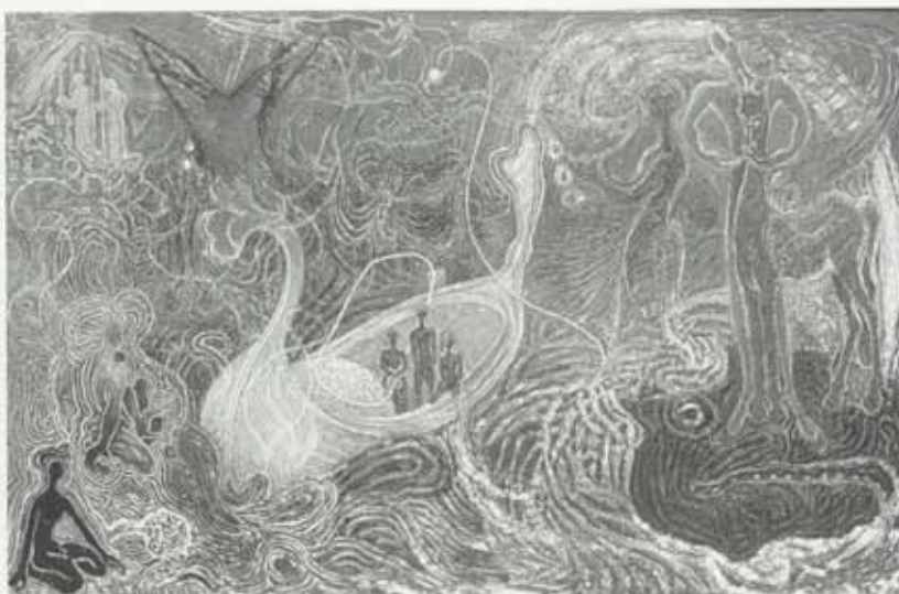
Ævintýri á hafinu, 1948, olía á striga, 88 x 137 cm, einkaeygn