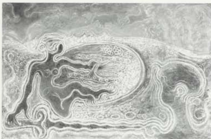
Skjaldmey, 1961, ollá á striga, 102 x 152 cm, Kjarvalsafn

Í nóvember 1950 birtist í tímaritinu Líf og list grein eftir Kjarval sem nefnist „Íslenzkt litaspjald“. Þar kemur fram sá skilningur að náttúran sjálf – litir hennar og litbrigði sem taka stöðugum breytingum vegna árstíða, veðurfars og birtuskilyrða – sé litaspjald. Hann gerir það að tillögu sinni að bestu listamenn þjóðarinnar skapi þróunarsögu fyrir íslenzkt litaspjald ... það er við raunverulega spjaldsetningu á náttúrulitum lands okkar og línum . 35 Í samræmi við þessar hugleiðingar nefndi hann nokkur verk sín þessu nafni, „Litaspjald“, ásamt árstíðarnafni. Í þessum verkum, sem flest eru frá tímabilinu 1955–65, sýnir hann ekki hið eiginlega litaspjald heldur er um að ræða landslagsmyndir þar sem hann kannar litbrigði náttúrunnar á ýmsum tímum árs. Litaspjald – sumar frá 1963 er eitt þessara verka og þar túlkar hann sumarlíti hraunsins. Í verkinu Litaspjald náttúrunnar frá 1966 sýnir Kjarval hins vegar litaspjald í náttúrunni. Hann dregur upp útlínur litaspjaldsins í forgrunn verksins en aðgreinir það ekki að öðru leyti og sýnir þannig hin órjúfanlegu tengsl litaspjaldsins við náttúruna. Í verkinu Litaspjald frá um 1965 málar Kjarval hins vegar litaspjald í kúbíseruðu landslagi, en í takt við hugmyndir sínar um að náttúran sé í raun litaspjald gætir hann samræmis á milli litanna á litaspjaldinu og í landslaginu umhverfis.