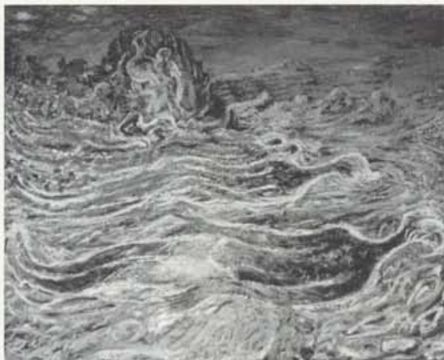
Storknaður hraði, 1954, olía á striga, 105 x 130 cm, einkaeign

sem virðist ganga út úr hól og tvö dökka sveina sem bera hönd að enni og skoða föngulega nakta konu sem liggur uppi á hraunborg. Í forgrunni verksins er hraunhóll, sem einnig er vangamynd, og maður með staf gengur á klettinn. Hér er komið dæmi um þá tvítræðni formanna sem svo oft kemur fyrir í fantasíum Kjarvals, eins konar felumynd sem ekki er augljós við fyrstu sýn.