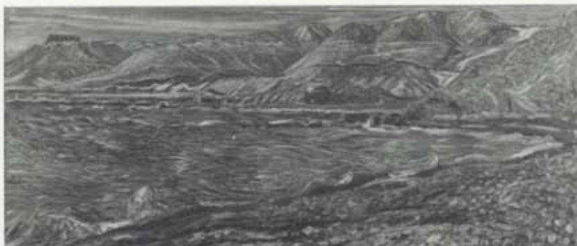
Frá Skagaströnd, haust, 1946, olía á striga, 117 x 278 cm, einkaeign