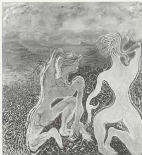
Svanasöngur, 1956–66, olía á striga, 157 x 134 cm, Listasafn Íslands