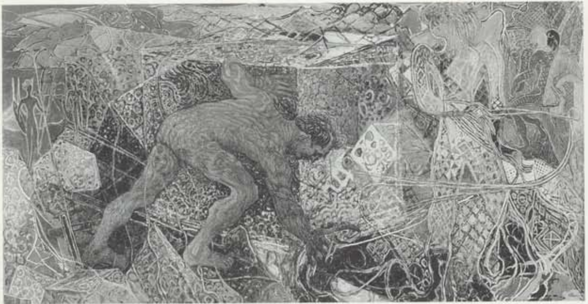
Kritik, 1946–47, olla á striga, 213 x 402 cm, Kjarvalssafn

væri að við eigum þessar myndir allar sameiginlega. 6 Hugleiðingar hans um sameign þjóðarinnar á listinni endurspeglast enn fremur í áhuga hans fyrir því að á Íslandi yrði stofnað listasafn í rúmgóðum húsakynnum. Þetta baráttumál bar oft á góma í skrifum hans og verður nánar vikið að því síðar.