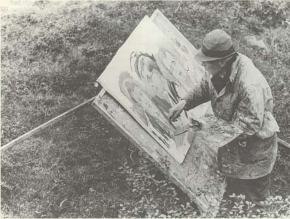
Kjarval úti í hrauni sumarið 1963 að mæla mynd af sænskum kvikmyndagerðarmónum og ljósmyndurum.

Heimildir benda til þess að Kjarval hafi flutt endanlega í húsnæðis fyrir ofan Blikksmiðju Breiðfjörðs í Sigtúni á fyrstu mánuðum ársins 1960. 139