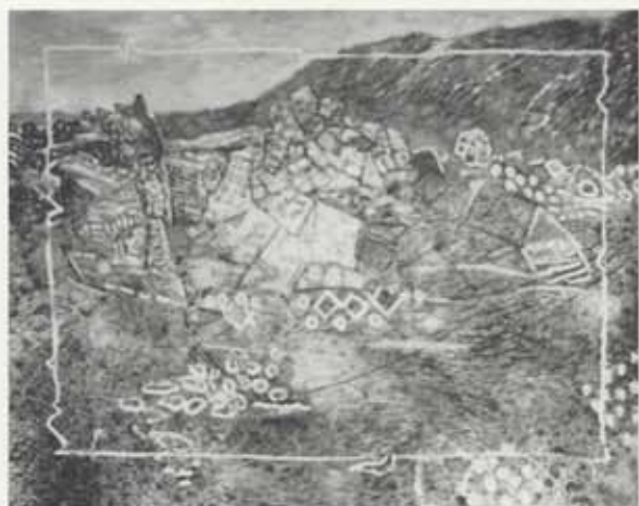
Úr Vífilsstaðahrauni (Yndisleg vorrótt), 1966, olía á striga, 110 x 136 cm, einkaeign