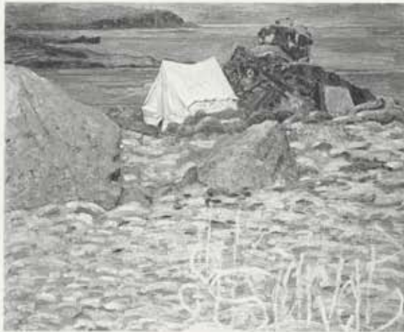
Tjald mitt, 1946, olía á striga, 112 x 128 cm, einkaeign

Eftir þessa uppákomu hafði Kjarval þann háttinn á að sýningar hans voru ekki sölusýningar; í viðtali 1949 segir hann að það trufla sýninguna að hafa myndir til sölu, og að best