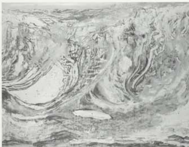
Esjan í vorleysingu (Útsýni frá Sigtúni), 1956-57, olía á striga, 110 x 145 cm, einkaréign

gríms: En skilyrði þyrftu að vera til þess að gleði mín héldist óblandin ... bjart og smekklegt listasafni ... allar myndirnar í einum sérstökum hóp í einum sérstökum sal, þar sem þú skildist. 29 Kjarval gerði sér einnig vel grein fyrir hinum róttæku breytingum í íslensku listalífi um miðbik fimmta áratugarins og í greinum um list Svavars Guðnasonar í Vísir 1949 ítrekar hann enn og aftur þörfina á íslensku listasafni, svo listvinir geti jöfnum höndum notið þess almenna í list og þess óskiljanlega . 30 Í ósk Kjarvals um byggingu listasafns endurspeglast enn fremur menningarlegur metnaður hans fyrir hönd þjóðarinnar og áhugi á bættri borgarmenningu í Reykjavík, sem var gamalt baráttumál sem hann hafði sett fram í skrifum sínum um skipulag, þar sem fagurt og menningarlegt mannlíf var sett á oddinn.