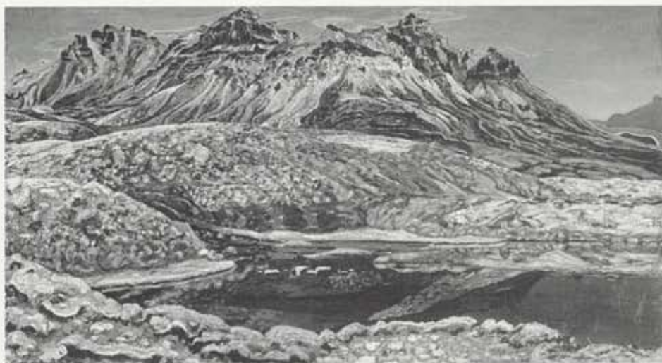
Sjón er sögu ríkari, 1948, olía á striga 120 x 229 cm, Danska þjóðþingið

Kjarval hafði haft þann háttinn á allt frá 1930, þegar hann fór að mála landslag úrivið, að mála fleiri en eina mynd af sama myndefni frá sama stað, oft heilar myndraðir. Hann segir í úrvarpsviðtali 1957: Listin mín er innifalinn í mótifinu og á mörgum myndum af sama mótifi ef mér finnst það verra það gott að það sé hægt að búa til margar myndir af því úr sama staði, ekki kópiera mynd af mynd, heldur standa og sjá mótifið í mismunandi veðri. 21 Á fjórða og fimmta áratugnum málaði Kjarval myndraðir á Þingvöllum, en einnig í nágrenni Reykjavíkur, með Esju og Vífilfell sem mótíf.