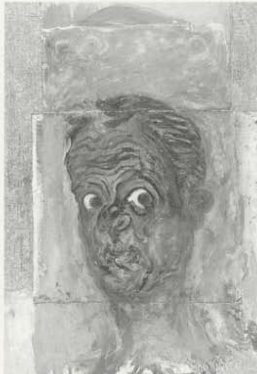
Portrett af Ivar Modéer, 1959, olía á pappír og striga, 94 x 64 cm, Kjarvalsstafr

Portrettið af Ivari Modéer endurspeglar einmitt þá skoðun Kjarvals að portrett eigi ekki að líkjast ljósmynd og eigi síst af öllu að fegra fyrirsætu sína, en mikilvægt sé að verkið sýni