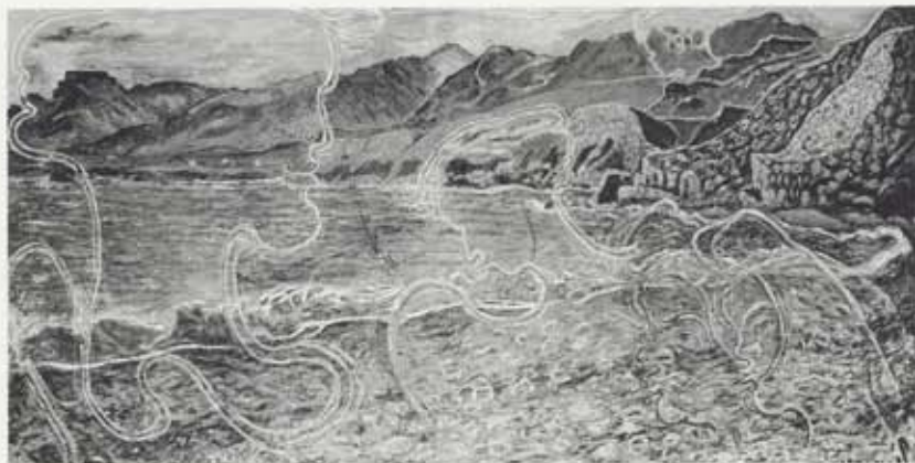
Skagaströnd. Hann er að norðan gróinn, um 1950, olía á striga, 114 x 210 cm, einkaeign