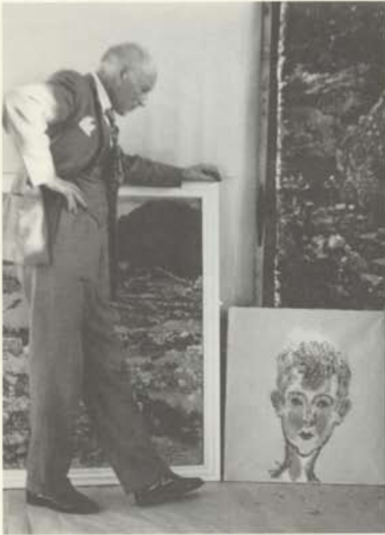
Kjarval við upphengingu sýningar sinnar í febrúar 1961.