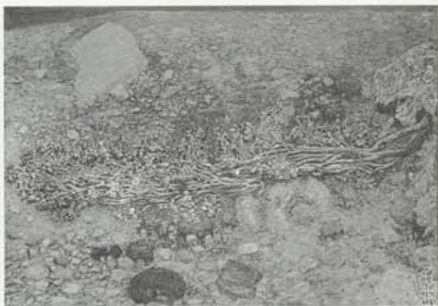
Hríða, 1949, 84 x 109 cm, einkaeign