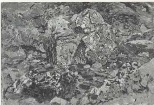
Litaspjald, sumar, 1963, olía á striga, 106 x 160 cm. Kjarvalhsafn