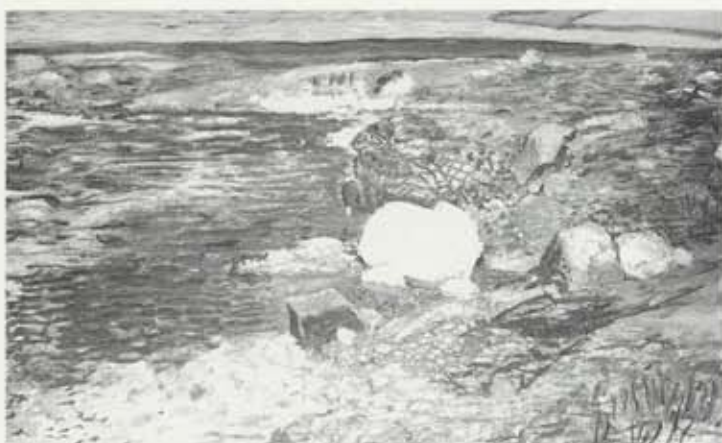
Bleikdalsá, 1967, olía á striga, 100 x 152 cm, Kjarvalsafn

Kjarval stóð utan og ofan við meginstrauma í íslenskri myndlist á því tímaskiði sem hér hefur verið til umfjöllunar, en um miðjan fimmta áratuginn var hann orðinn þroskaður listamaður með mótaða lífssýn og stíl. Hann var sprottinn úr jarðvegi þjóðernishyggjunnar og sem listamaður mótaður af möðernisma fyrstu áratuga aldarinnar. Verk hans frá tímabilinu 1946–68 eru eðlilegt framhald verka hans frá fyrri tíð og á þessu tímaskiði koma ekki fram neinar afgerandi breytingar á list hans. Ferill hans einkennist fremur af jafnri stígandi og nýjum útfærslum á þeim meginhugmyndum sem fram voru komnar um 1945.