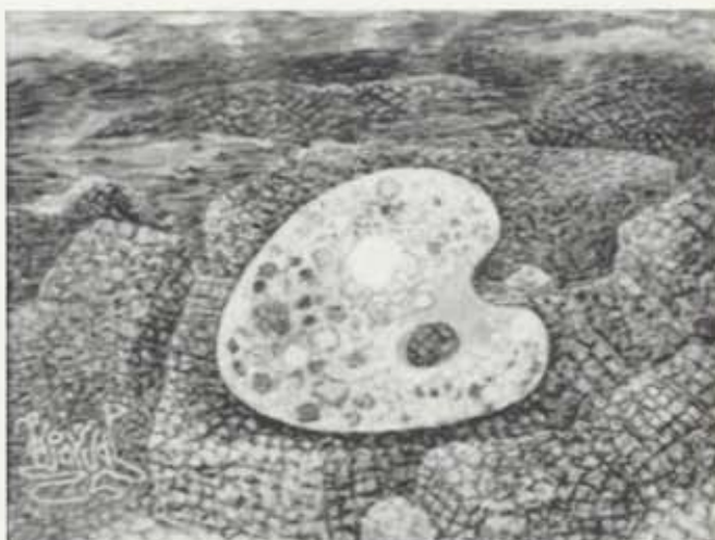
Litaspjald, um 1965, olía á striga, 34 x 39,5 cm, einkaeygn