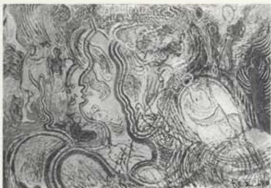
Fantasia, 1949, olía á striga, 102 x 115 cm, Listasafn Íslands