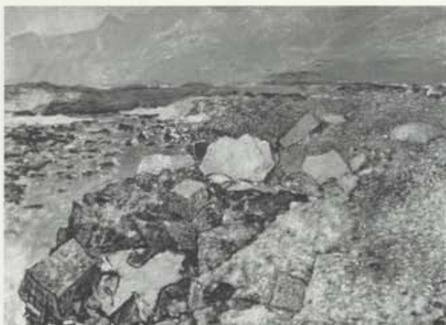
Nú andar hlýju vori (Fjallasvalinn angar/Bleikdalsá), 1966, olía á striga, 100 x 140 cm, einkaeign