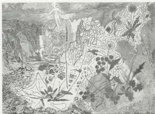
Íslandslag, Hvassirgljúfur, 1949-50, olía á striga, 115 x 155 cm, Listasafn Íslands