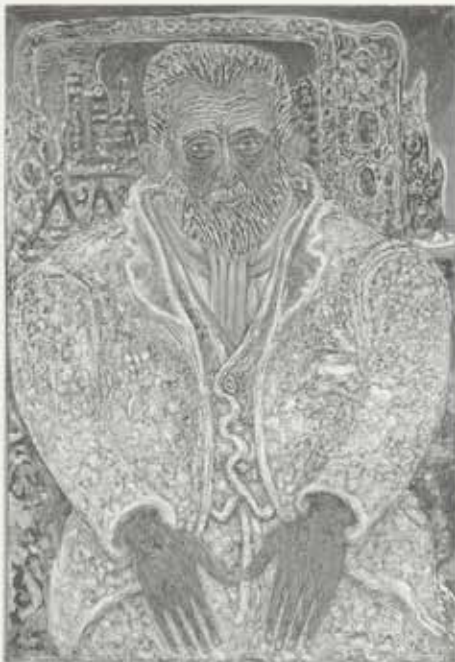
Við sjóinn frammi (Sigurður í Görðum), 1959, olía á striga, 130 x 99 cm, Listasafn Íslands

persónueinkenni viðkomandi – án of mikillar alvöru. Kjarval kaus helst svipsterka karla sem fyrirmyndir. Sigurður í Görðum var einn þeirra.