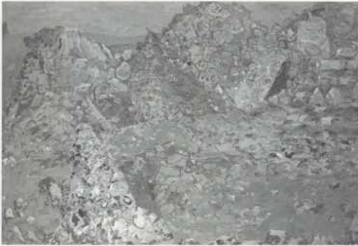
Úr Gálgahrauni, 15. október 1956, olía á striga, 100 x 150 cm, einkaeign