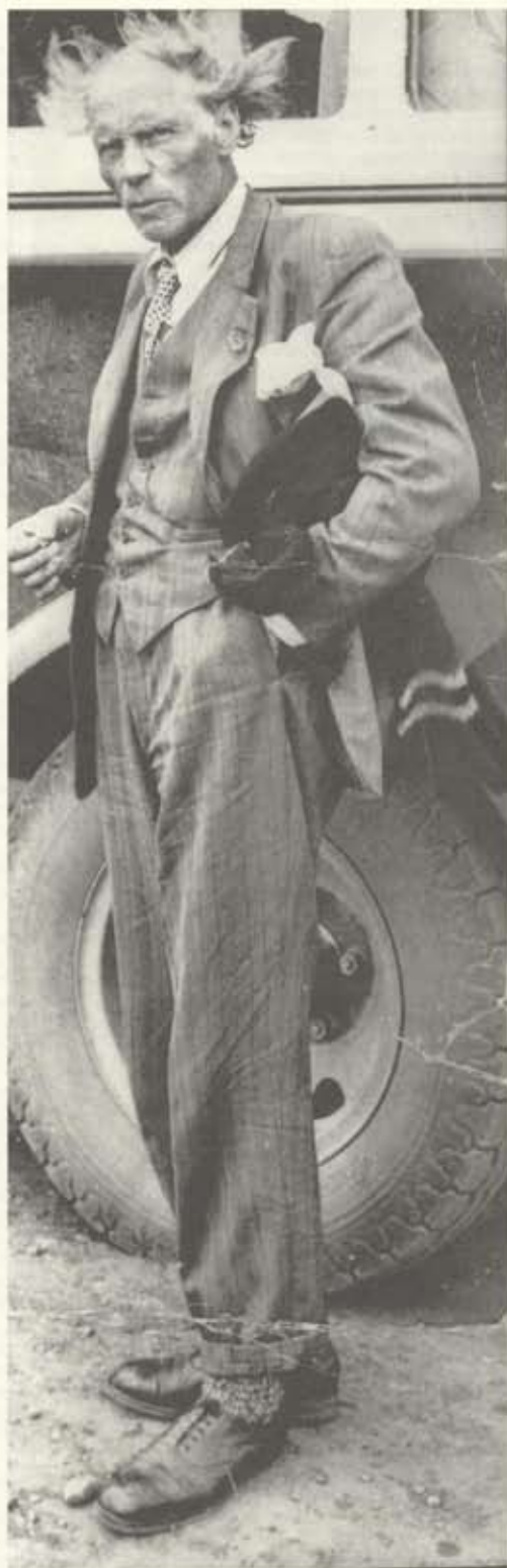
Kjarval áir við Fornahvamm á leið til Reykjavíkur í ágúst 1950.