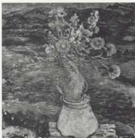
Þakklátur hugur, 1961, olía á striga, 94 x 97 cm, einkaeign

Kjarval sýndi þessa mynd í Listamannaskálanum í febrúar 1961 en í mars sama ár skrifaði hann Erró og sendi honum mynd af verkinu. Í bréfinu kemur fram að Kjarval var nokk-