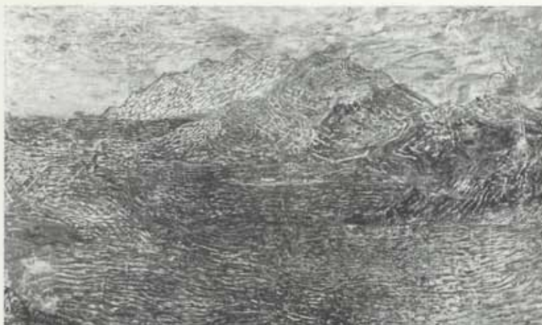
Heyburður eftir Heklugos, 1947–66, olía á striga, 162 x 275 cm, Listasafn Íslands

myndmál Kjarvals var þrívíddarmyndgerð með hyrningslaga formbyggingu. Um 1930 vann Kjarval kúbískar abstraksjónir, sem oft voru skrautkenndar með ýmiss konar tíglaunstri og á sama tíma fór að bera á kúbískri umskrift í landslagsverkum hans, sem hann þróaði áfram á næstu áratugum.