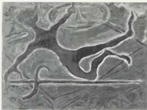
Skjaldmey, 1955–56, ollá á striga, 38 x 50 cm, einkaeign