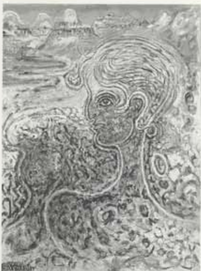
Fyrstu snjóar, 1953, olía á striga, 125 x 95 cm, Kjarvalsafn

að er teikningasafn hans, sem varðveitt er á Kjarvalsstöðum. Teikningarnar endurspegla ævintýralegt ímyndunarafl og frjóan huga í óheftri og frjálslegri tjáningu.