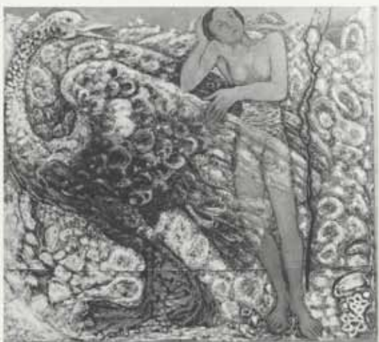
Flugþrá, 1935-54, olía á striga, 145 x 155 cm, Listasafn Íslands