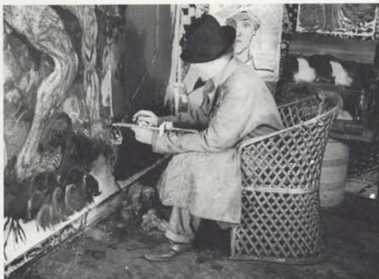
Kjarval málar verk sitt Sólbað og þrældómur sem síðar fékk nafnið Sól og sumar og var fyrst sýnt 1949.

aðdáun samtímans, en um augu hans lærðu Íslendingar að sjá land sitt í nýju ljósi. 2 Kjarval hafði á námsárum sínum og eftir að námi lauk leitast við að kynna sér það helsta í samtímalist og klassískri list. Eftir því sem innlifun hans í íslenska náttúru dýpkaði virtist hann hins vegar fjarlægjast erlenda áhrifavalda sína. Hann mótaði sterkan og sérstakan stíl, sem vísar til áhrifavalda hans en var fyrst og fremst afar persónulegur. Ferð Kjarvals til Parísar 1928 varð í raun síðasta eiginlega kynnis- og námsferð hans. Eftir það fer hann einungis fjar og stuttar ferðir á sjötta áratugnum og hinum sjöunda, til Danmerkur, Noregs og Ítalíu, og þær mörkuðu ekki spor í list hans. Hann hafði þó sterk tengsl við hinn vaxandi íslenska listheim og var þar ekkert óviðkomandi. Hann skrifaði um árabíl umsagnir um listsýningar í Vísi, og þau skrif bera með sér mikla elskusemi gagnvart íslenskum listamönnum. Hann fjallaði með sömu alúðinni um allar liststefnur og gerði ekki upp á milli þeirra, en stundum voru greinar hans nokkuð torskildar. Hann var hafinn yfir alla flokkadrætti í listum og var lifandi og fordómalaus þátttakandi í listalífínu.