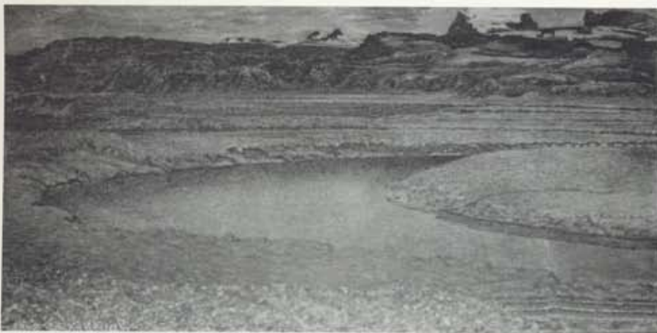
Sumar við Selfjót, 1948, olli á striga, 109 x 215 cm, einkaeign

raunar allt sem hann skrifar sé afar huglæg og persónuleg, að sjón hans sé sérkennilega fersk og skilningurinn minni á opinn barnshuga. 13