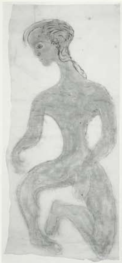
Vera, um 1960, olía á pappi, 56 x 125 cm, Kjarvalsúafi

Í viðtali við Kjarval skömmu eftir 80 ára afmælið segist hann þjást af svefnleysi, ekki hafa áhuga á neinu núna, vera utan við hið hversdagslega mannlega og ómannlega, vera þreyttur af engu og hafa enga ástríðu til að fara út á land að mála. 39