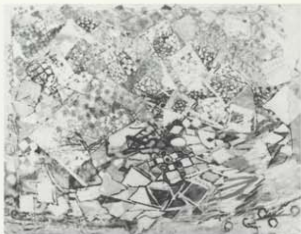
Leysing, 1964, olía á striga, 112 x 10 cm, einkaeign