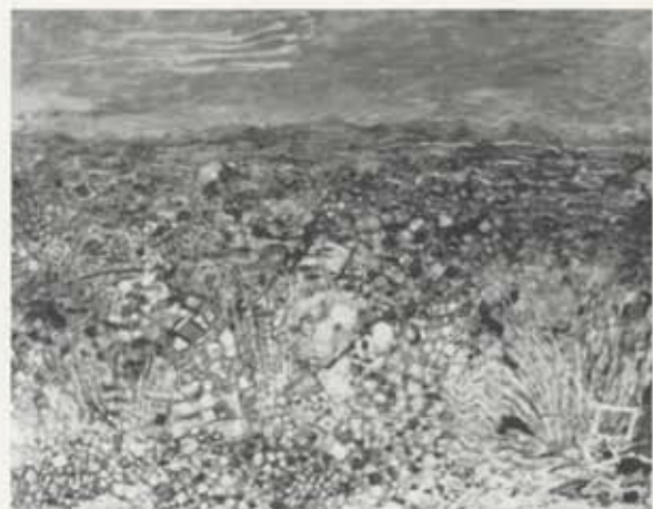
Frá Þingsvöllum, 1967-68, olía á striga, 108 x 137 cm, einkaeign