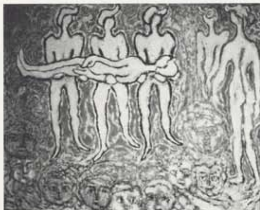
Skýjafar, um 1955, olía á striga, 120 x 150 cm, einkaeign