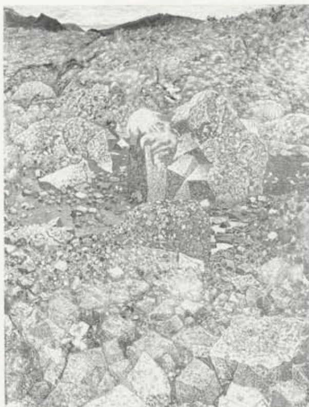
Skjaldbreiður – séð frá Grafningi, 1957–62, olía á striga, 205 x 154 cm. Kjarvalssafn