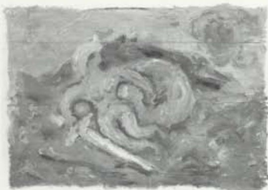
Skjaldmey, 1954–55, ollá á pappír, 49 x 68 cm, einkaeign