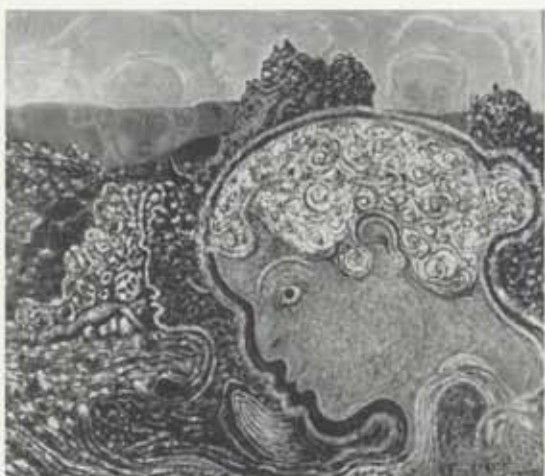
Sigrún, 1953-54, olía á striga, 87 x 100 cm, einkaeign