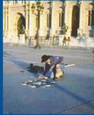
Púsl / Puzzle, Paris, 1991