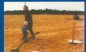
Veðurteikning 1991 í Gróttu