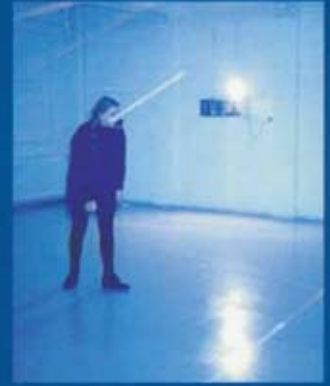
Landamæralinur / Borderline, 1993