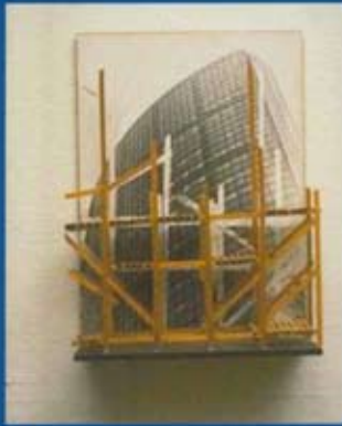
Vinnupallar / Scaffolds, Rotterdam, 1995