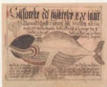
Mynd úr ritgerð Jóns lærða um hvalakyn From the essay of Jón "the learned" on whales