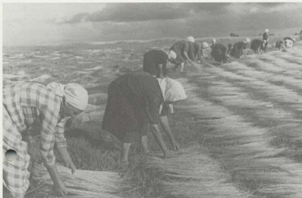
Leonid Shokin / Kornskurður / Laying in of flax seeds. Um 1920.

en róttæk greinaskrif. Fréttaljósmyndun var aðeins á mótunarsigli í Rússlandi fyrir 1917, en hin nýju stjórnmöld studdu greinina af krafti.