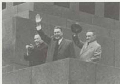
I fyrsta sinn án Krouschev (Alexei Kosygin, Leonid Brezhnev, Anastas Mikoyan & Graphysj Lenini). / Without N.Khrushchev for the first time (Alexei Kosygin, Leonid Brezhnev, Anastas Mikoyan on the Mausoleum tribune). Moskva / Moscow. 1960.