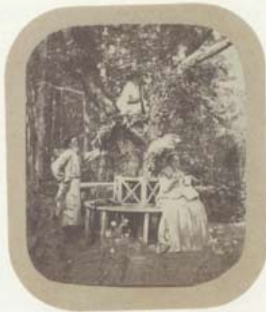
G. Nostitz / Höpmynd á sveitasetrinu. / Group portrait in the country house. Um 1850 / The 1850's

Olga Sviblova Forstöðumaður Ljósmyndasafns Moskvu