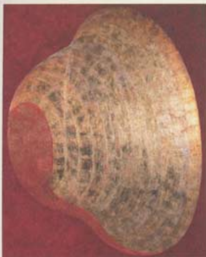
Corpus lucis sensitivus - Innihaldið þitt, 2004 Corpus lucis sensitivus – your conent óliulitur, blaðsilfur og litarduft á striga oil, sheet silver and pigment on canvas 160 x130 cm.