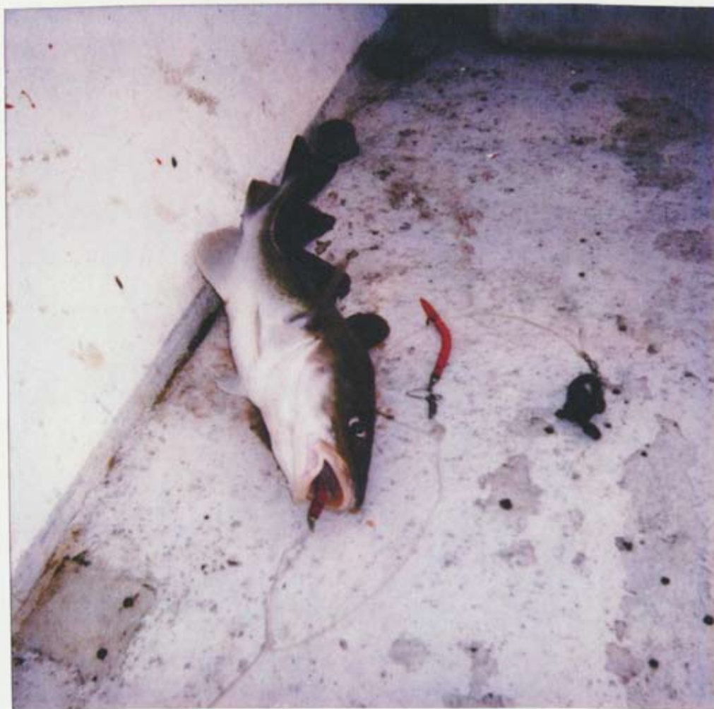
Finnur Arnarsson / An seldu, Unfiled.