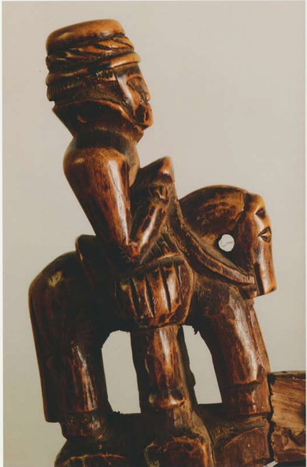
Reiðmaður á stól úr Draflastaðakirkju frá 16 öld