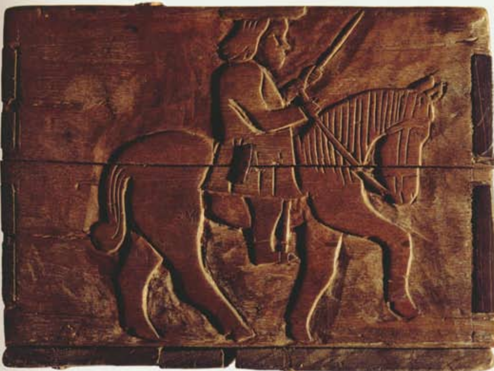
Maður á hestbaki, tréskurður á treflastokki, frá seinni hluta 17. aldar

Fluga bar sem sagt hærri hlut, en Örn tók ósigri og fémissi svo illa að hann „vildi eigi lifa og fór upp undir fjallið, er nú heitir Arnarfell, og týndi sér þar sjálfur, en Fluga stóð þar eftir, því að hún var mjög móð.“ En sagan er ekki á enda, því Þórir dúfunef skilur Flugu eftir á Kili, þar sem hann taldi sig hafa gengið of nærri hryssunni á þeysireiðinni. Á leiðinni til baka frá Þingvöllum rekst Þórir aftur á Flugu sína, en þá er með henni grár hestur föxóttur, líklega keppinautur hennar sem Örn hafði riðið og var hún fylfull eftir hann. Um framhaldið segir Landnáma: „Undir þeim var alinn Eiðfaxi, er utan var færður og varð sjö manna bani við Mjörs á einum degi, og lést hann þar sjálfur.“ Samkvæmt sömu bók týndist Fluga að lokum í feni við bæinn Flugumýri í Skagafirði, þar sem enn má finna Flugufen.