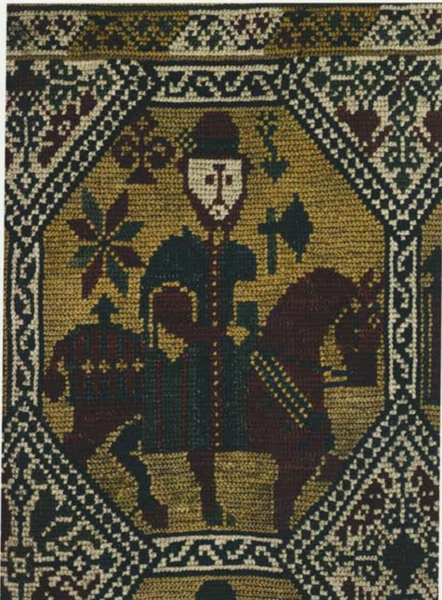
Hestamaður, hluti „Riddarateppis“ sjá bls. 17