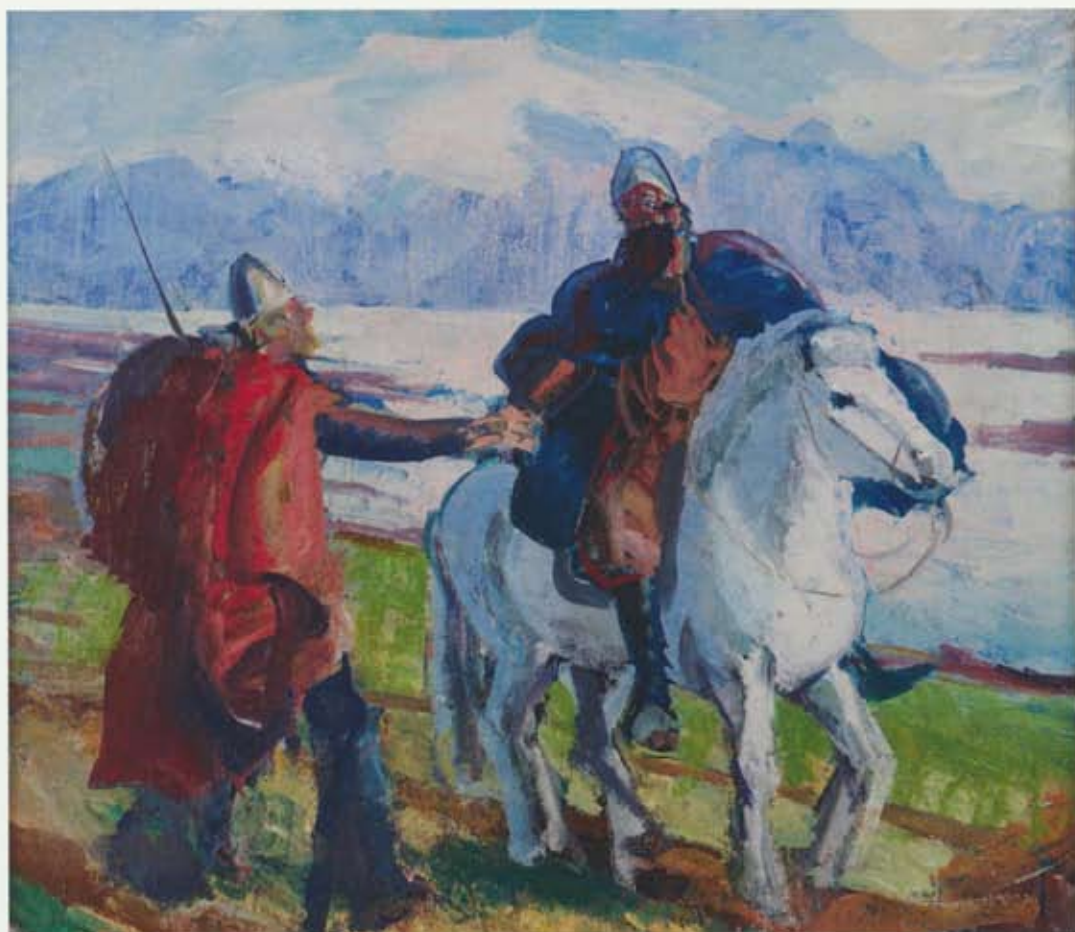
Ásgrímur Jónsson Gunnar og Kolskeggur, 1915–20 90 x 105 cm

Síðan tilgreinir Grágás alls kyns viðurlög við því að taka hesta ófrjálsri hendi. Meira að segja urðu menn að greiða sekt fyrir það eitt að fara á bak hesti án þess að spyrja eiganda. Viðurlög þyngdust eftir því sem riðið var lengra: „Þrjár hrossreiðir eru þær er skóggang varða. Ein er ef maður ríður svo að þrír bæir eru á aðra hönd, og ríði hann um þá. Önnur er ef maður ríður um fjöll þau er vatnsföll deilir af á meðal héraða. Þriðja ef maður ríður á milli landsfjórðunga.“ Síðan voru þeir sem höfðu góðhesta sína í svo miklum hávegum að þeir hétu dauða hverjum þeim sem kæmu á bak þeim; af einni slíkri heitstrengingu spratt fræg saga af hestinum Freyfaxa, miklum örlagavaldi í lífi manna í Hrafnkels sögu Freysgoða.