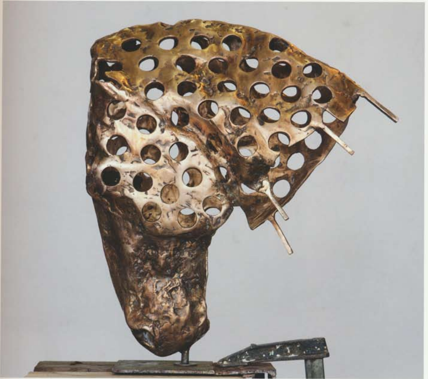
Helgi Gislason Kengála 1974–2011 50 x 45 x 15 cm