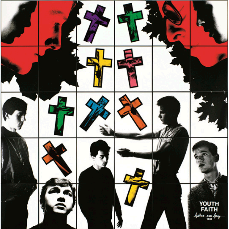
Youth Faith, 1982 | 302 x 301 cm