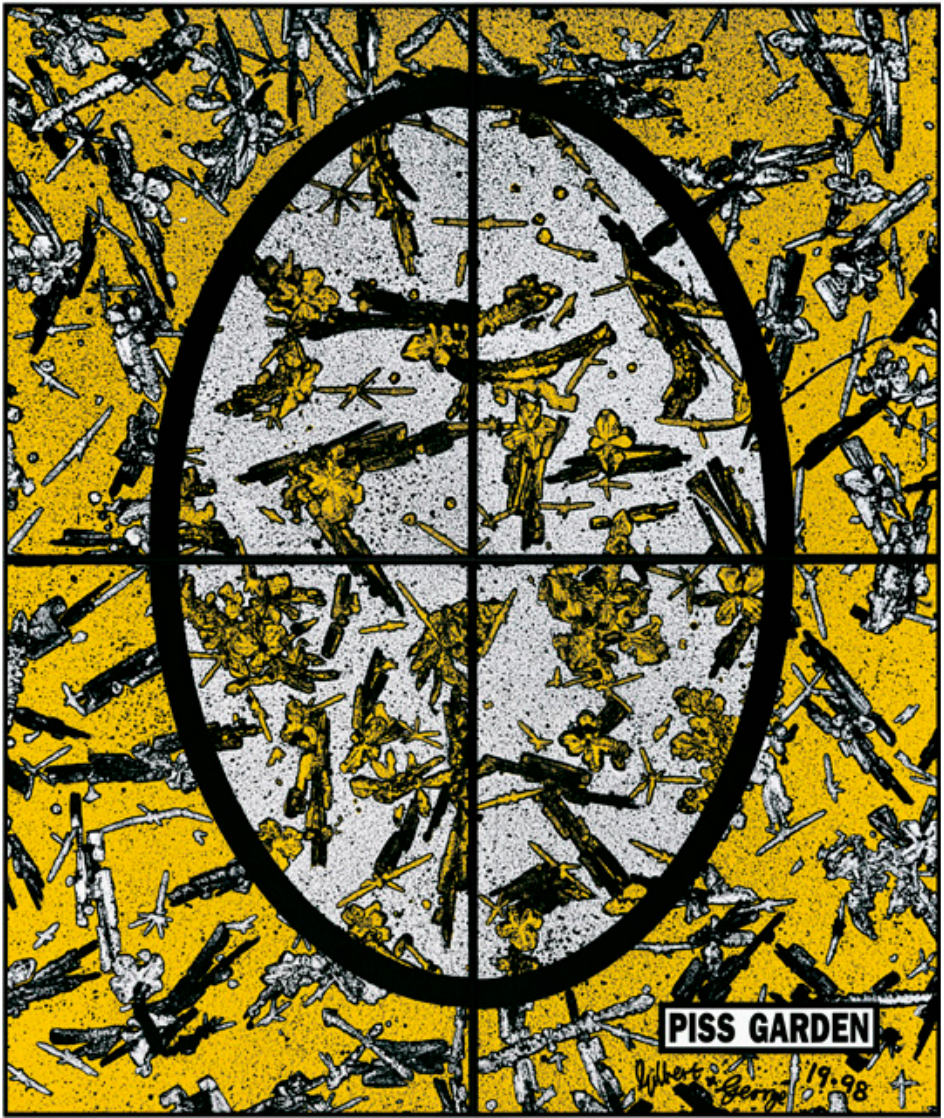
Piss Garden , 1998 | 151 × 127 cm