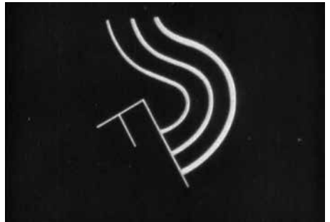
Viking Eggeling (Svibjöd / Sweden 1880–1925 Þýskaland / Germany) Stíllur úr kvikmynd / Stills from Flm Diagonal Symphony, 1921