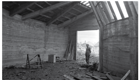
Myndin var tekin meðan var verið að byggja skeifulaga skálann (1955–1959). During the construction of the U-shaped shed (1955–59).