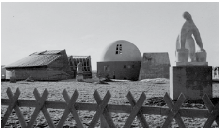
Þrjár byggingar hannaðar og byggðar af Ásmundi Sveinssyni. Svona leit húsið, ásamt höggmyndum meistarans, út á sjúnda áratugnum. The three buildings as designed and built by Ásmundur. Seen in the 1960s with sculptures by the artist.