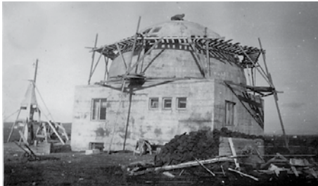
Hvellþingin í byggingu, en verkið hófst árið 1942. The dome under construction, which began in 1942.