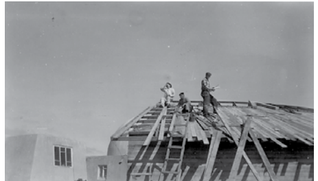
Ásmundur Sveinsson (maðurinn fyrir miðju) þegar verið var að reisa þriðja hluta byggingarinnar (1955–1959). Ásmundur Sveinsson (figure in the middle) during the construction of the third section (1955–59).